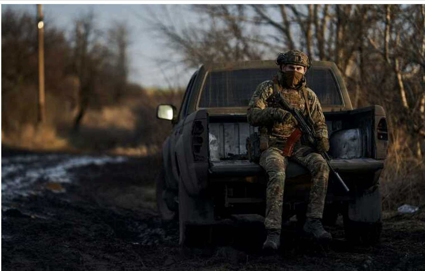
New York Times критикує слабкі оборонні позиції українських військ під Авдіївкою

Американське видання The New York Times повідомляє про слабкі оборонні позиції українських військ на захід від Авдіївки.