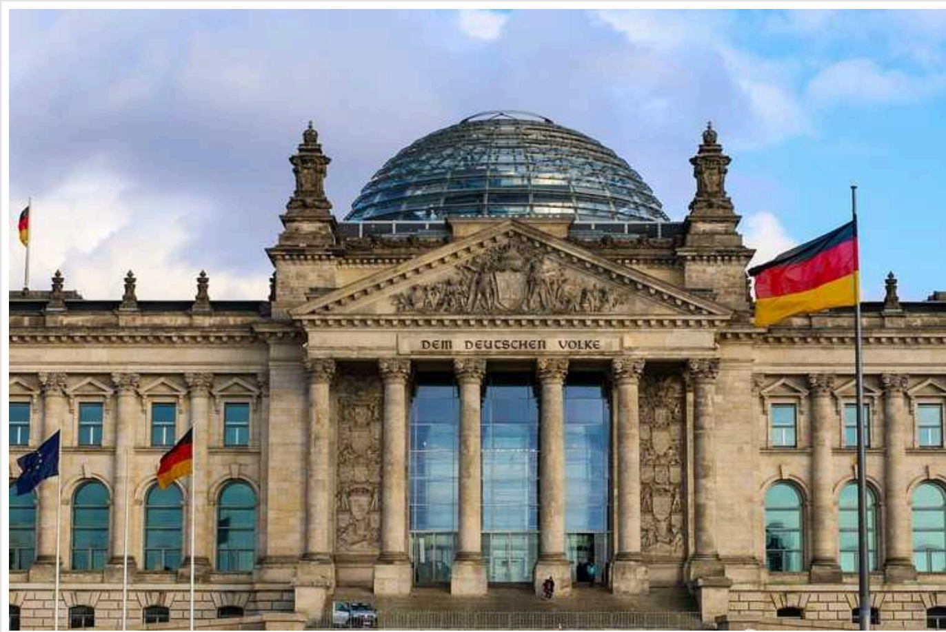
У Міноборони Німеччини підтверджують факт прослуховування

Міністерство оборони Німеччини підтвердило факт перехоплення розмови офіцерів Люфтваффе стосовно ракет.