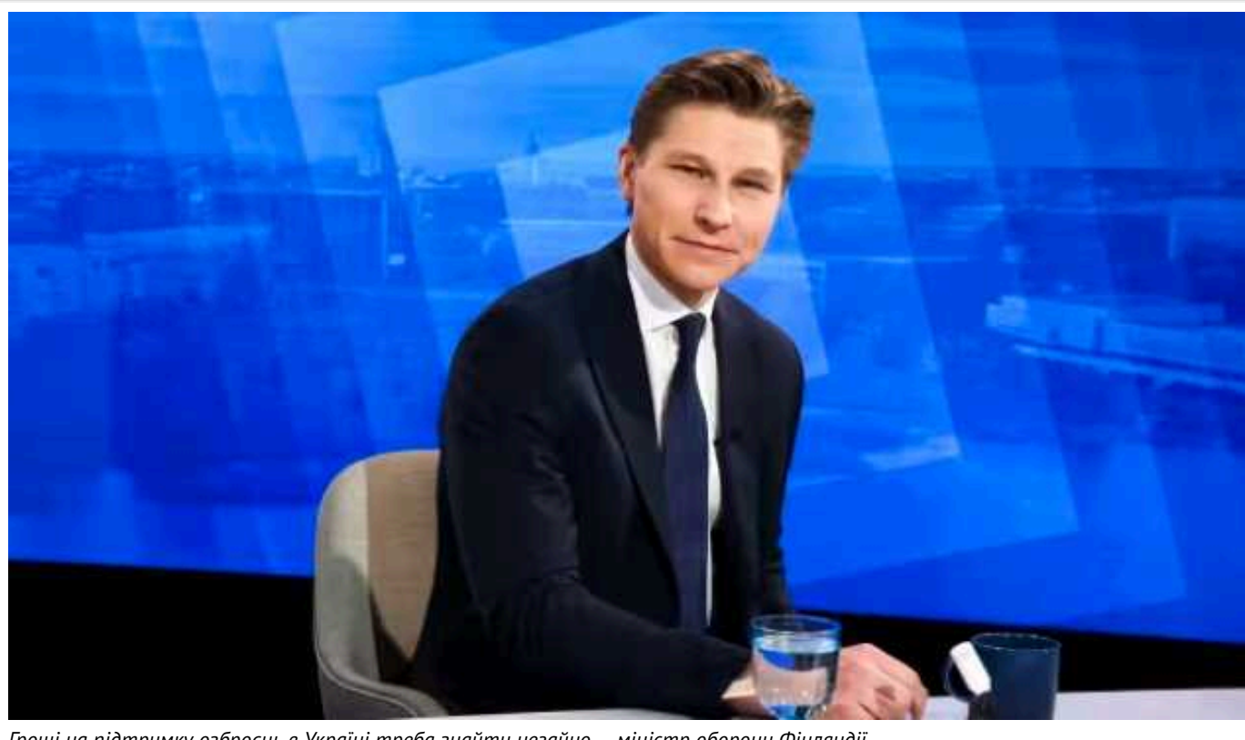
Гроші на підтримку озброєнь в Україні треба знайти негайно, – міністр оборони Фінляндії

Міністр оборони Фінляндії Антті Хяккянен у суботу закликає країни Заходу посилити підтримку України.