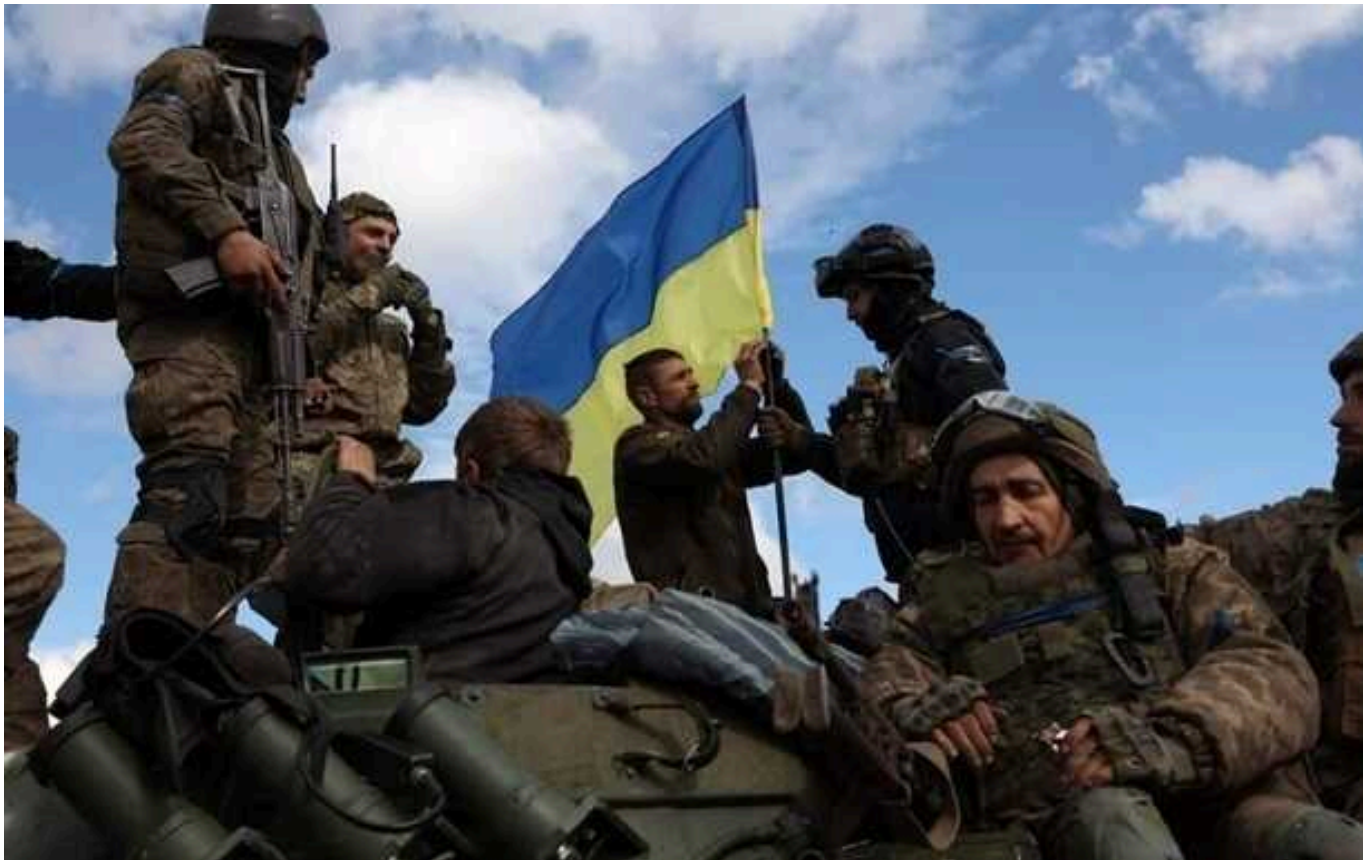
Ситуація на фронті: ворог завдав 1 ракетний і 48 авіаційних ударів

Протягом доби на фронті відбулося 70 бойових зіткнень. Російські війська атакували українські позиції на низці напрямків.