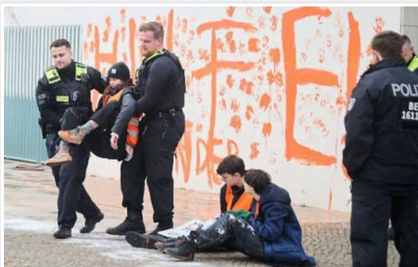
У Німеччині кліматичні активісти облили фарбою німецьку канцелярію

Члени групи кліматичних активістів "Останнє покоління" в суботу вранці облили помаранчевою фарбою фасад німецької канцелярії.