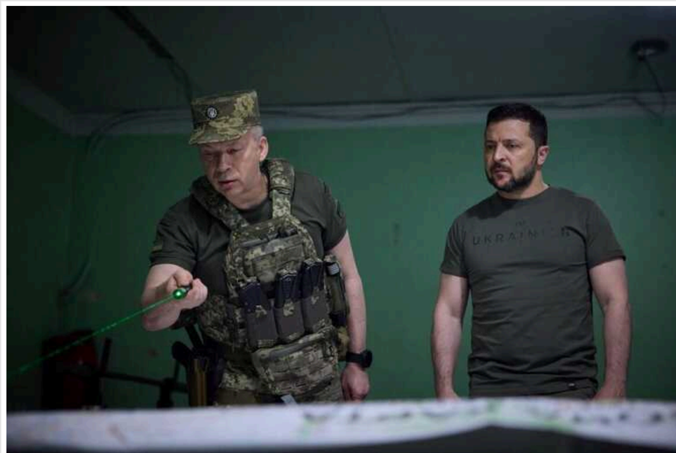
У Сирського карт-бланш на кадрові зміни, очікую конкретних пропозицій, – Зеленський

Президент Володимир Зеленський очікує на початку наступного тижня конкретних пропозицій головнокомандувача ЗСУ Олександра Сирського щодо подальших змін в армії й запланованих дій.