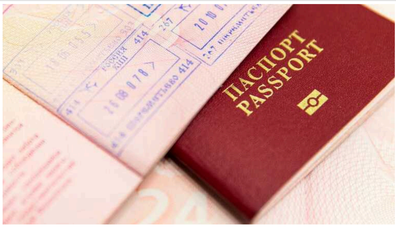
Бізнесмени відмовляються від російського громадянства