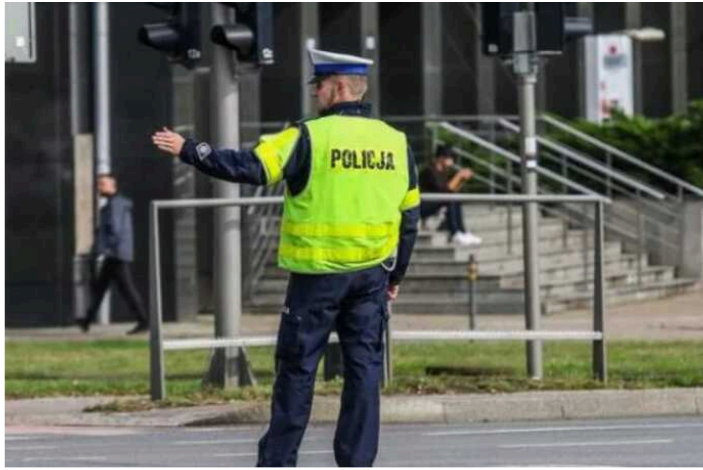
У Польщі власники автовок, які порушили ПДР, почали видавати себе за українців

Наразі власникам автовок вигідніше вказати особу, яка перебувала за кермом, але в Польщі відсутні ефективні системи обміну особистими даними та інформацією про водіїв між службами країн ЄС та країнами, які до них не належать.