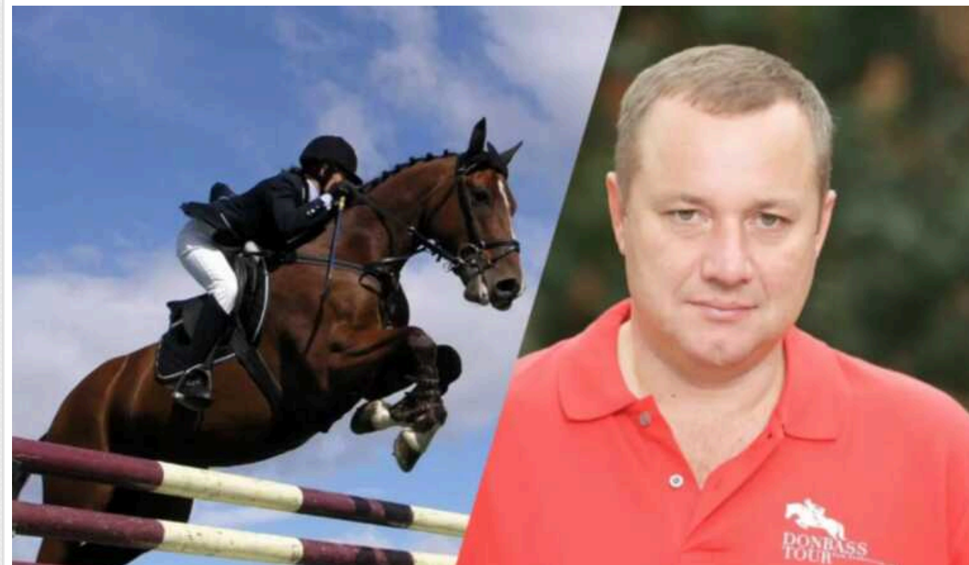
Всеукраїнська федерація кінного спорту України фігурує у справі про привласнення гуманітарної допомоги