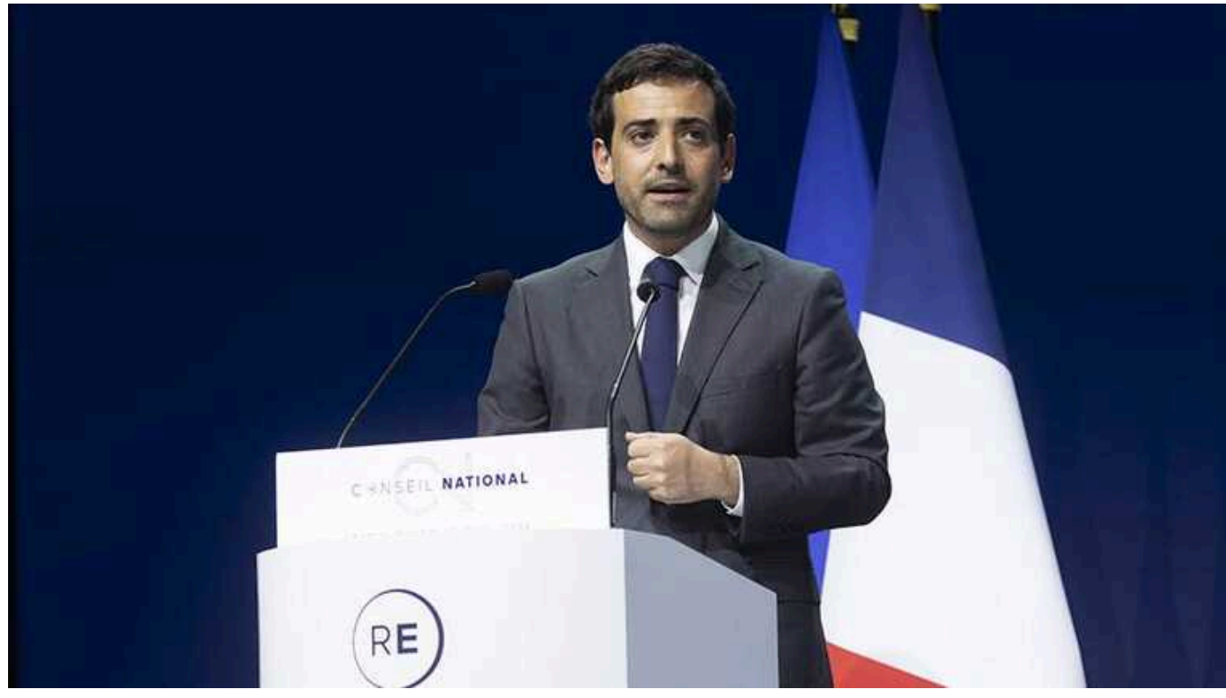
Перемога РФ в Україні призведе до фінансових втрат для Європи, – Сежурне

З економічного погляду ситуація стане "катастрофічною".