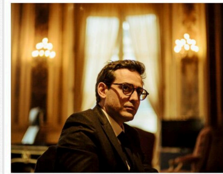
Stéphane Séjourné, ministre des affaires étrangères, au Quai d'Orsay, à Paris, le 1 er mars