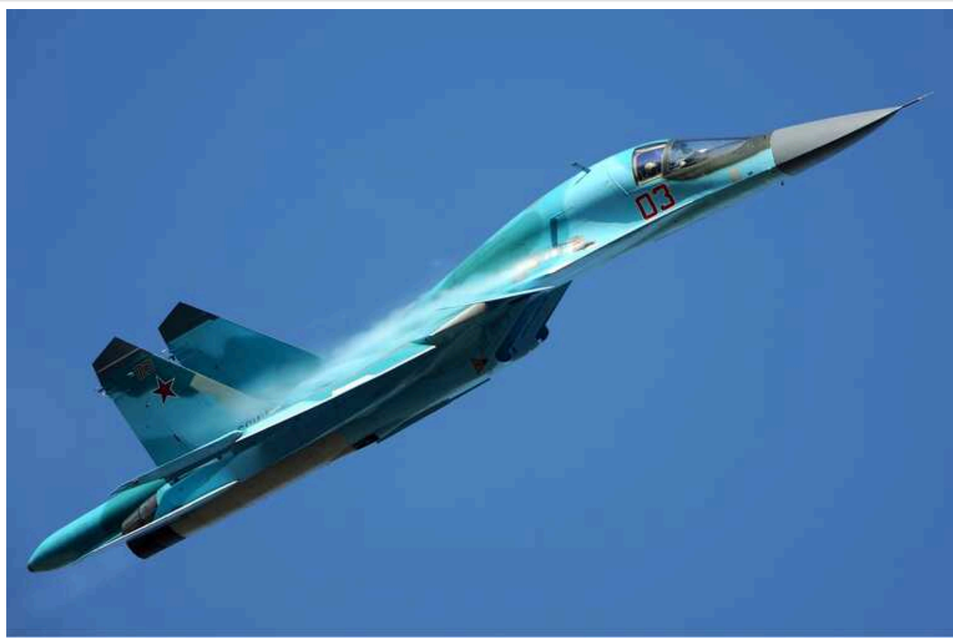
У Повітряних силах натякнули на знищення ще двох російських літаків

Українські військові, ймовірно, збили ще два ворожі літаки, які атакували лінію фронту керованими авіаційними бомбами. Зенітні керовані ракети відпрацювали по російським Су-34 та Су-35.