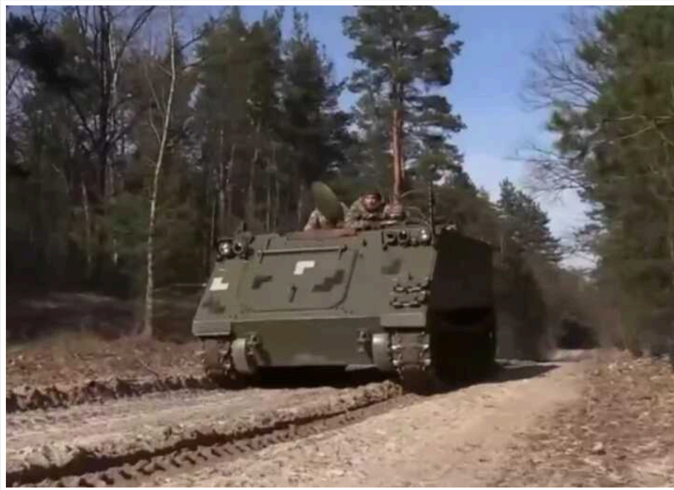
Прикордонники показали, як бойове «таксі» знищує ворогів і зберігає життя бійців

Українські прикордонники показали, як використовують на передовій американські гусеничні бронетранспортери M113. Бойове "таксі" допомагає нищити окупантів і зберігати життя захисників України.