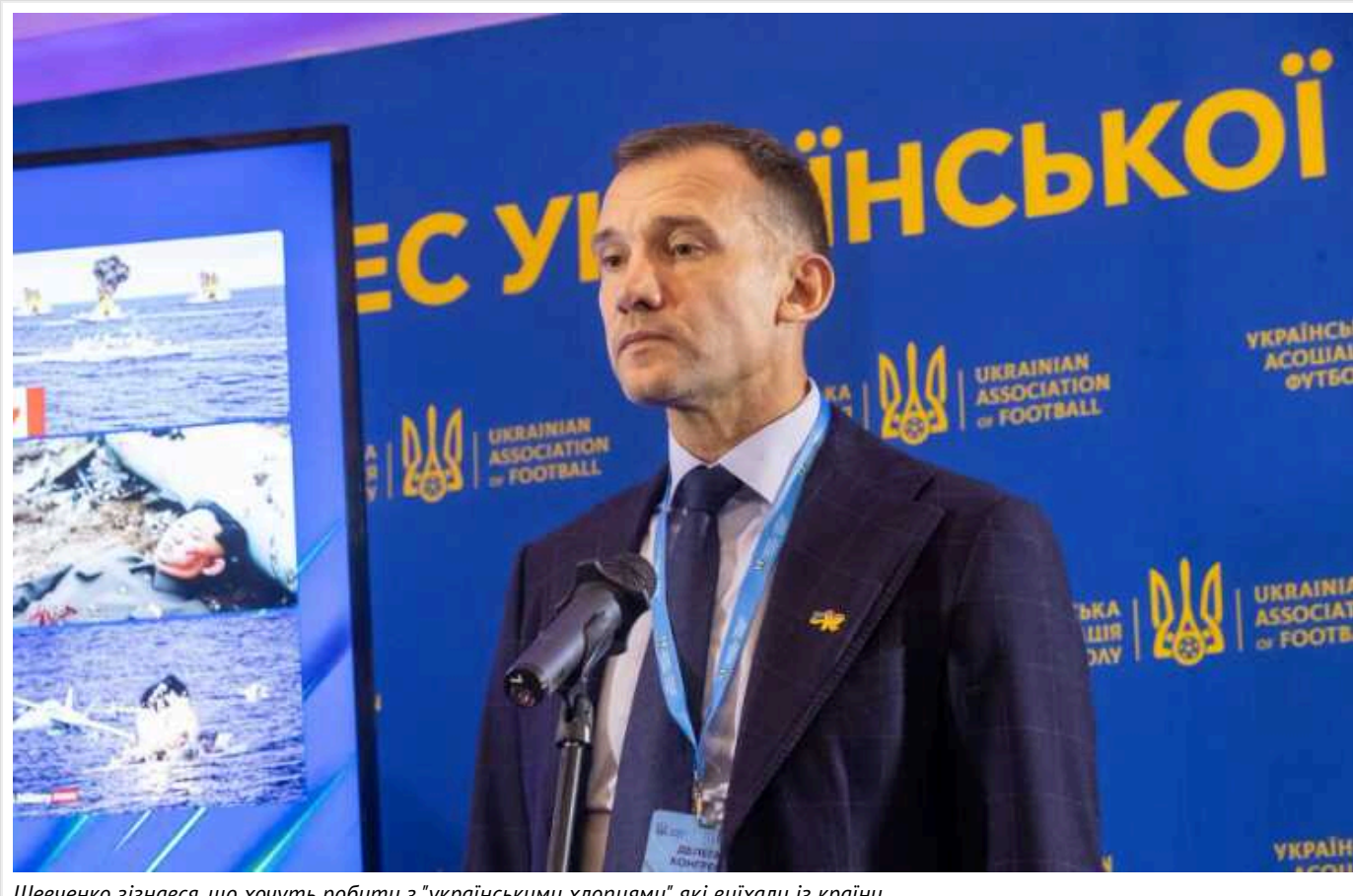
Шевченко зізнався, що хочуть робити з "українськими хлопцями", які виїхали із країни

Президент Української асоціації футболу (УАФ) Андрій Шевченко заявив, що Україна стежитиме за дітьми, які залишили країну, щоб не втратити їх для нашого футболу у майбутньому. За словами Андрія Миколайовича, зараз цим займаються скаути головного тренера національної збірної, а в майбутньому у цій справі також допомагатиме нова розробка.