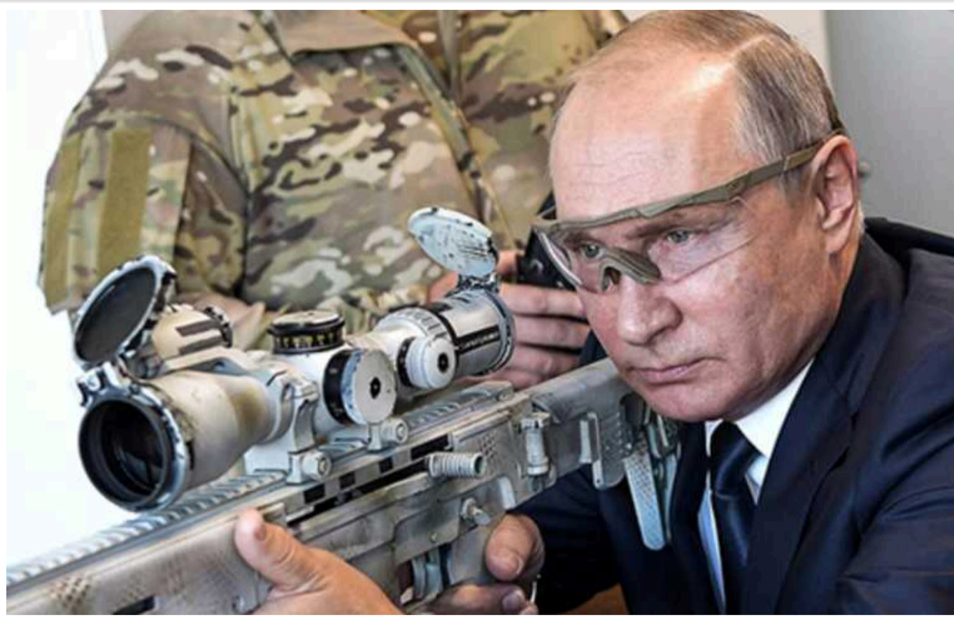
Василь Рибніков: Хто вб'є Такера Карлсона і коли ядерна війна?

Ще зовсім недавно у свідомості руських патріотів ці дві події були невіддільні одна від одної, але сталося так, що Такер виявився гадом, і тепер тому, хто його вб'є, за це нічого не буде.