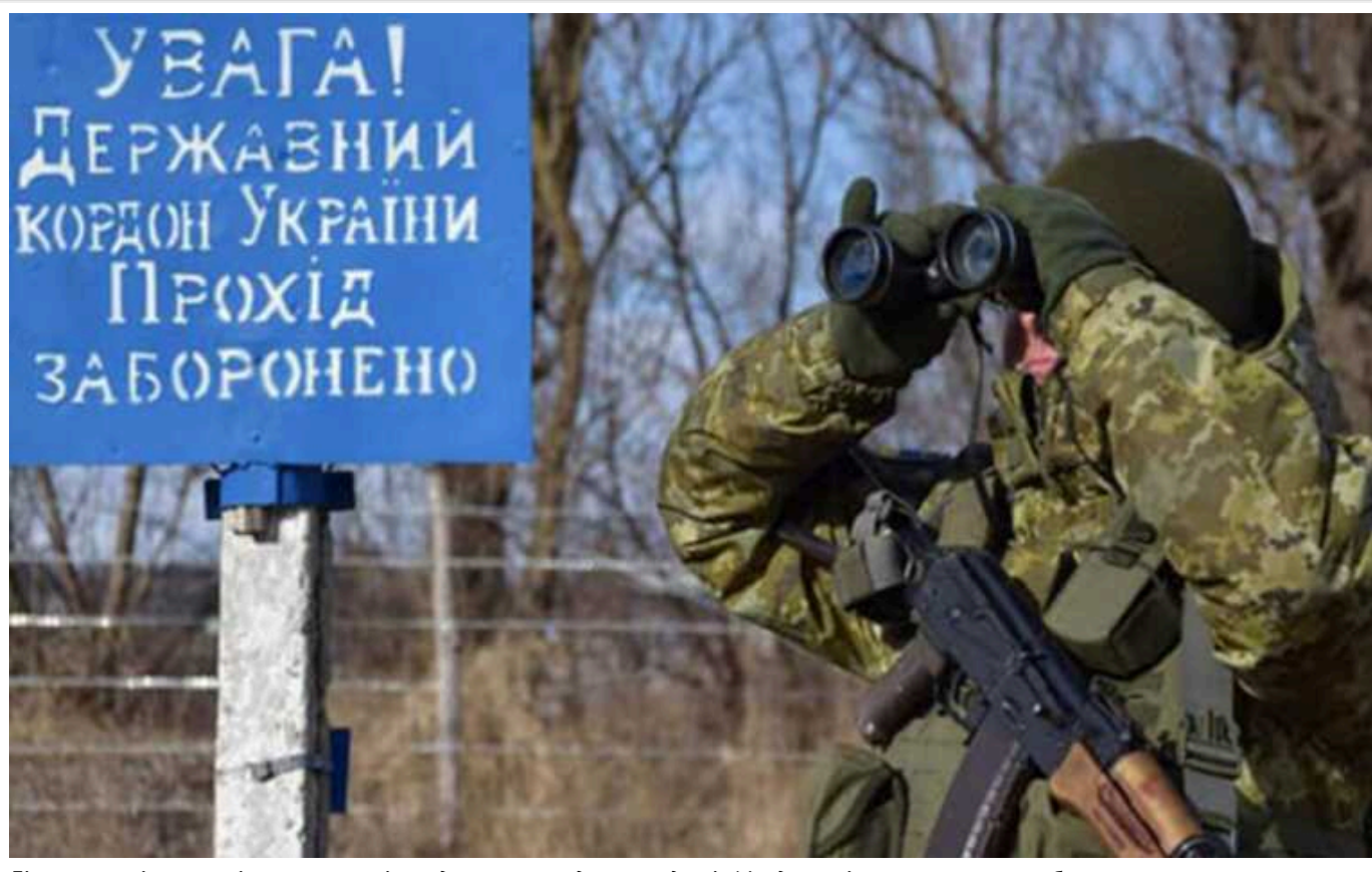
Бізнес на втікачах: скільки ухлянтів щоденно переходить кордон із Молдовою і хто на цьому заробляє

За два роки від початку великої війни кордон з Молдовою нелегально перетнули щонайменше 15 тисяч українських чоловіків призовного віку.