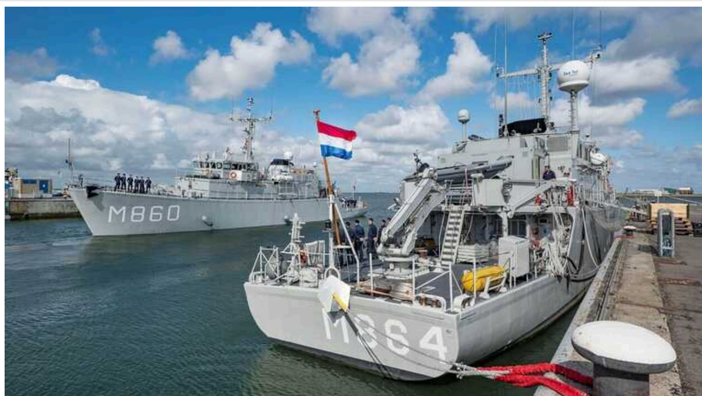
Нідерланди планують протягом наступних 15 років капітально оновити свій флот

Уряд Нідерландів 1 березня заявив, що протягом наступних 15 років замінить майже весь свій військово-морський флот у межах проекту, вартістю кілька мільярдів євро.