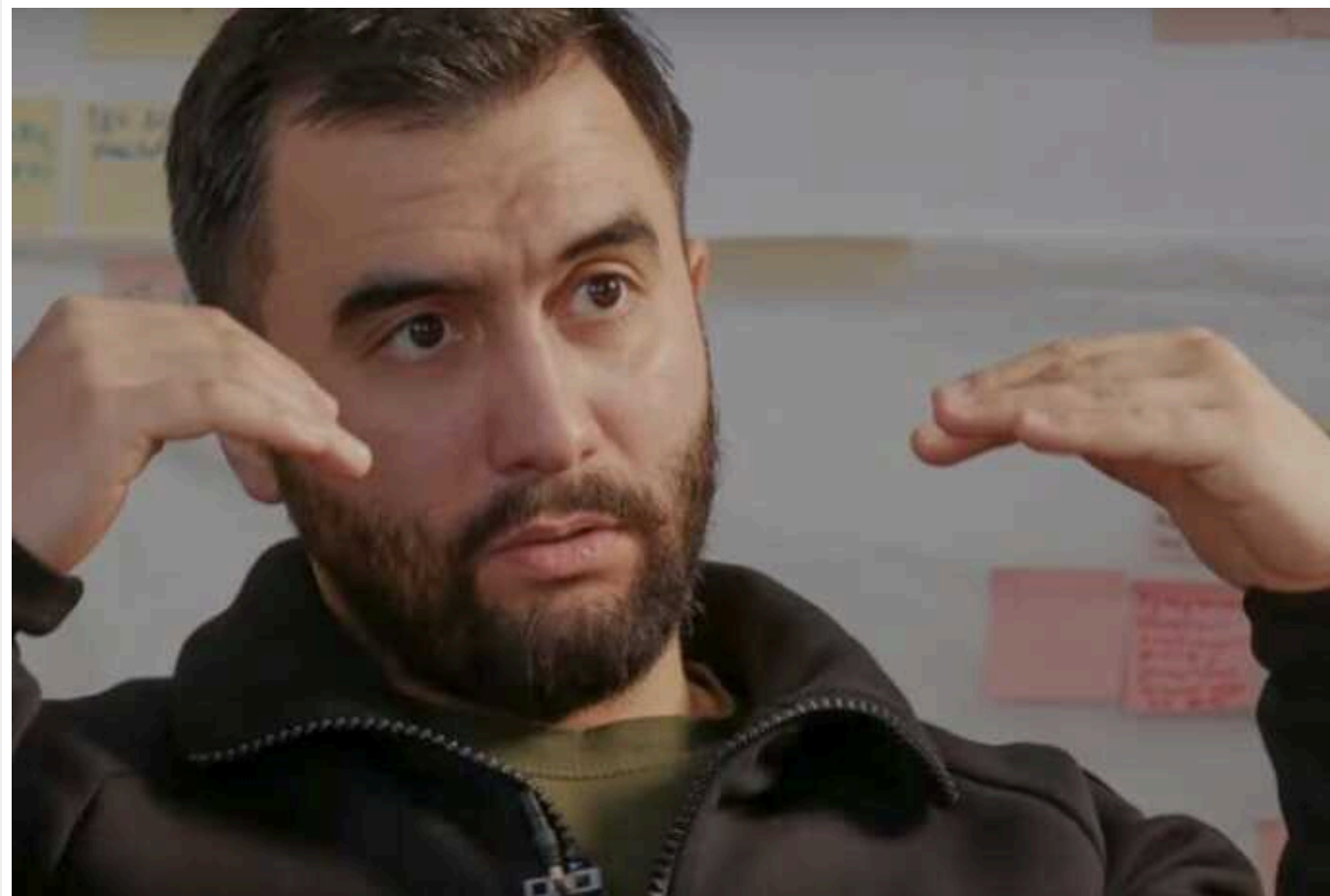
Жумаділов веде до катастрофи постачання їжі для ЗСУ і може залишити воїнів голодними, – ЗМІ

Ситуація із забезпеченням Сил оборони України через непрофесійні і зухвалі дії Арсена Жумаділова, який очолює новостворений «Державний оператор тилу», ставить під загрозу безперерйне постачання бійцям продуктів харчування.