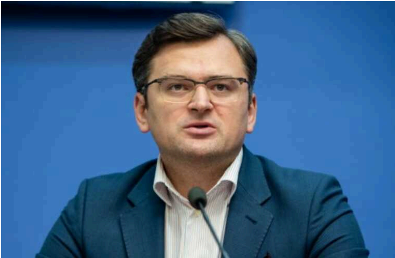
У МЗС України звернулись до Заходу після нового російського обстрілу українських міст

Глава МЗС Дмитро Кулеба після чергового російського обстрілу Харкова, Одеси та Сумської області закликає Захід замінити формулу "стільки, скільки потрібно" на "так швидко і стільки, скільки потрібно".