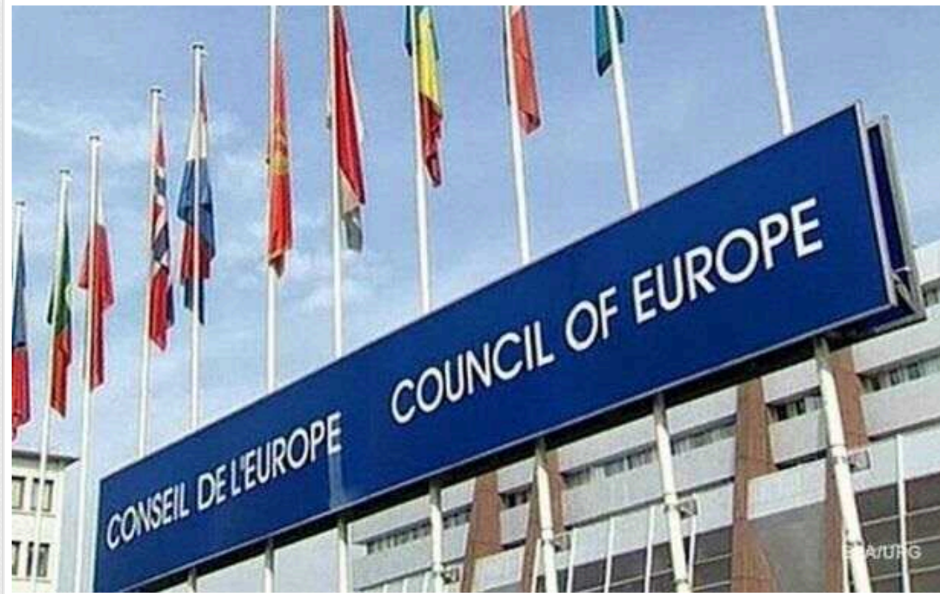
Латвія не згодна з критикою Ради Європи щодо ситуації з нацменшинами

Латвія не згодна з висновками експертів Ради Європи з критикою латвійської політики щодо нацменшин, вважаючи їх такими, що абсолютно не враховують історичний досвід Латвії та нинішню геополітичну ситуацію.