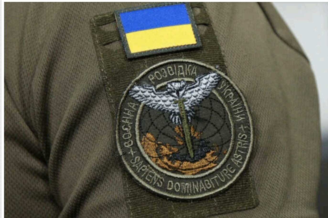
Російське та білоруське підприємства не змогли узгодити ціну на деталі до «Градів» - розвідка

Білоруське та російське підприємства не змогли узгодити ціну на виготовлення деталей до реактивних систем залпового вогню "Град".