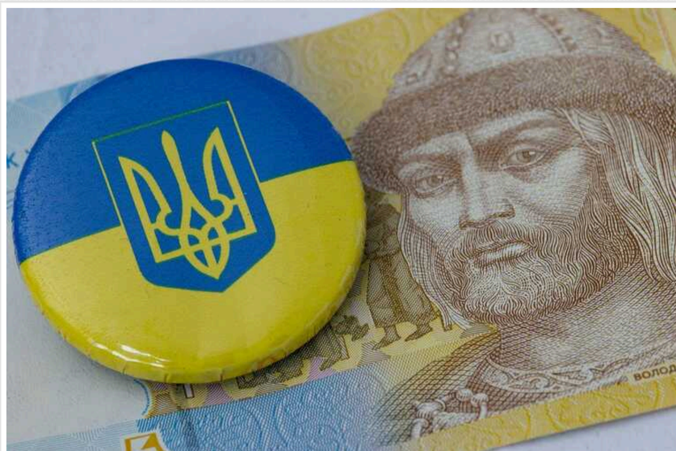
Гральний бізнес за 2023 рік заплатив у 37 разів більше податків, ніж за весь 2021 рік

За 10 місяців 2023 року гральний бізнес заплатив 7,35 мільярдів гривень податків, що вдвістєро більше проти минулого року та у 37 разів більше, ніж у 2021 році.