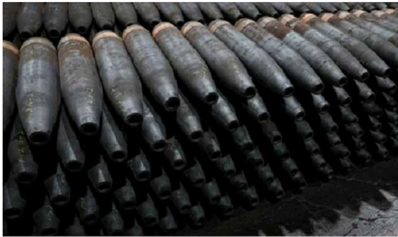
У Чехії очікують, що Україна за кілька тижнів отримає перші снаряди, придбані з-за меж ЄС

"Україна може вже за кілька тижнів отримати перші снаряди, придбані з-за меж ЄС", – повідомляє заступник міністра оборони Чехії Ян Іреш.