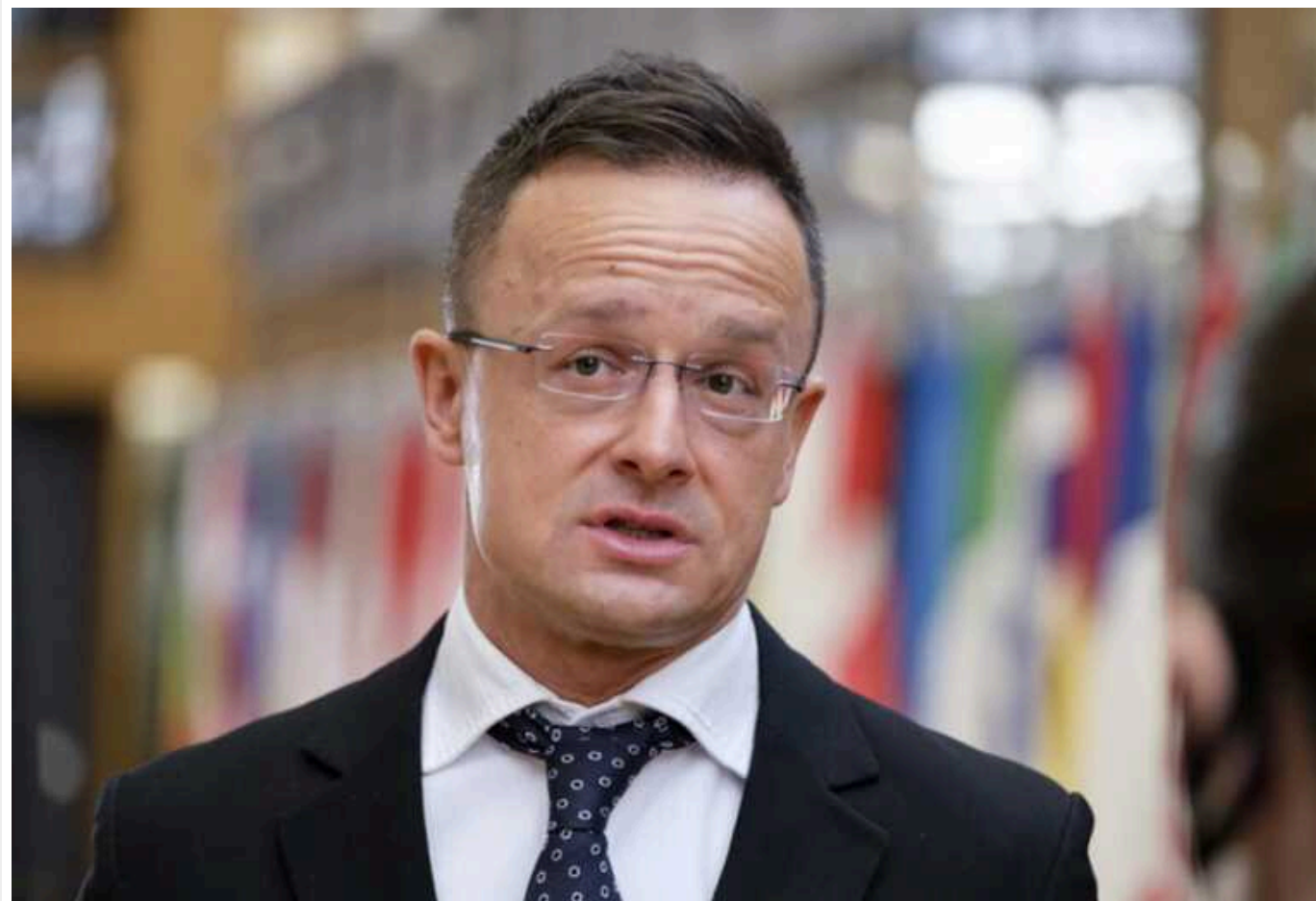
Угорщина передасть 18 мільйонів доларів Збройним силам африканської країни

Угорщина не надаватиме 18 мільйонів доларів на зброю для України. Натомість ці кошти передадуть Збройним силам африканської країни Чад.