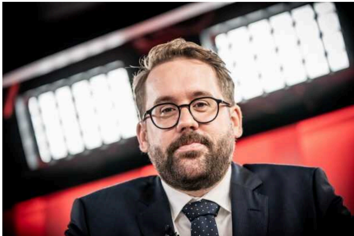
Президент Франції своїми заявами про відправку в Україну західних військ сильно нашкодив Києву, - Пауль Ронцхаймер

«Ці дебати, ініційовані на найвищому рівні, не лише небезпечні, а й завдають шкоди Україні на даний момент, оскільки не обговорюються справді важливі питання, такі як боеприпаси.