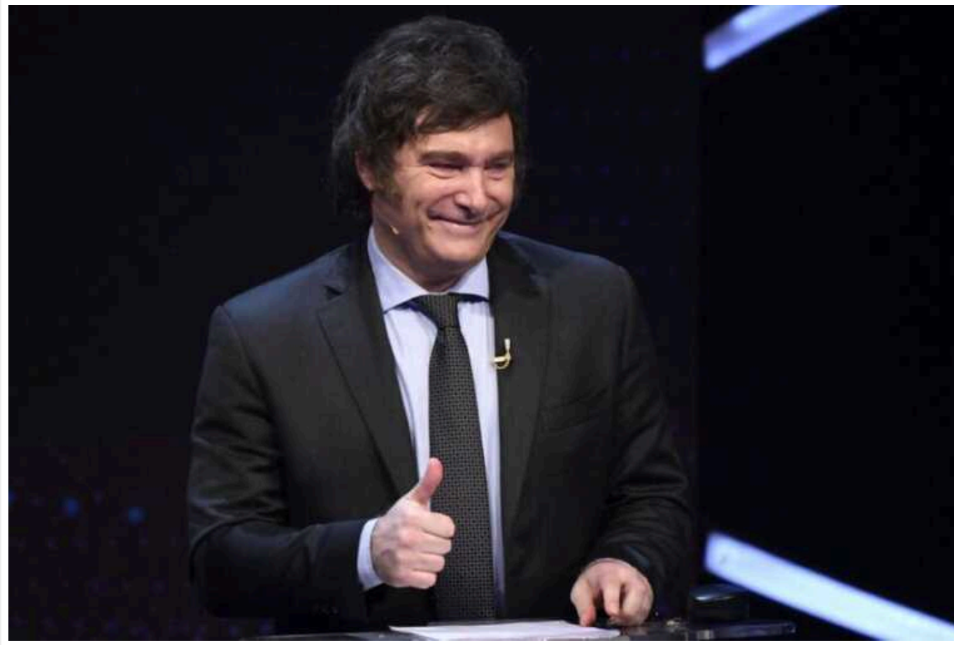
"З бідності не вийдеш магією": президент Аргентини Мілей пояснив, як витягне економіку країни із кризи

У бюджеті Аргентини різко скоротили соціальні виплати та пенсії. Президент Хав'єр Мілей впевнений, що не треба зупинятись – він планує відпустити курс валют.