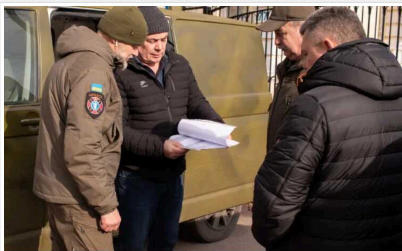
У Черкасах чиновники "заробили" на безкоштовно наданому автомобілі для військових

В облуправлінні освіти відвітували про придбання автомобіля для одного з підрозділів Сил оборони. Виявилось, що його купила для українських захисників родина з Норвегії.