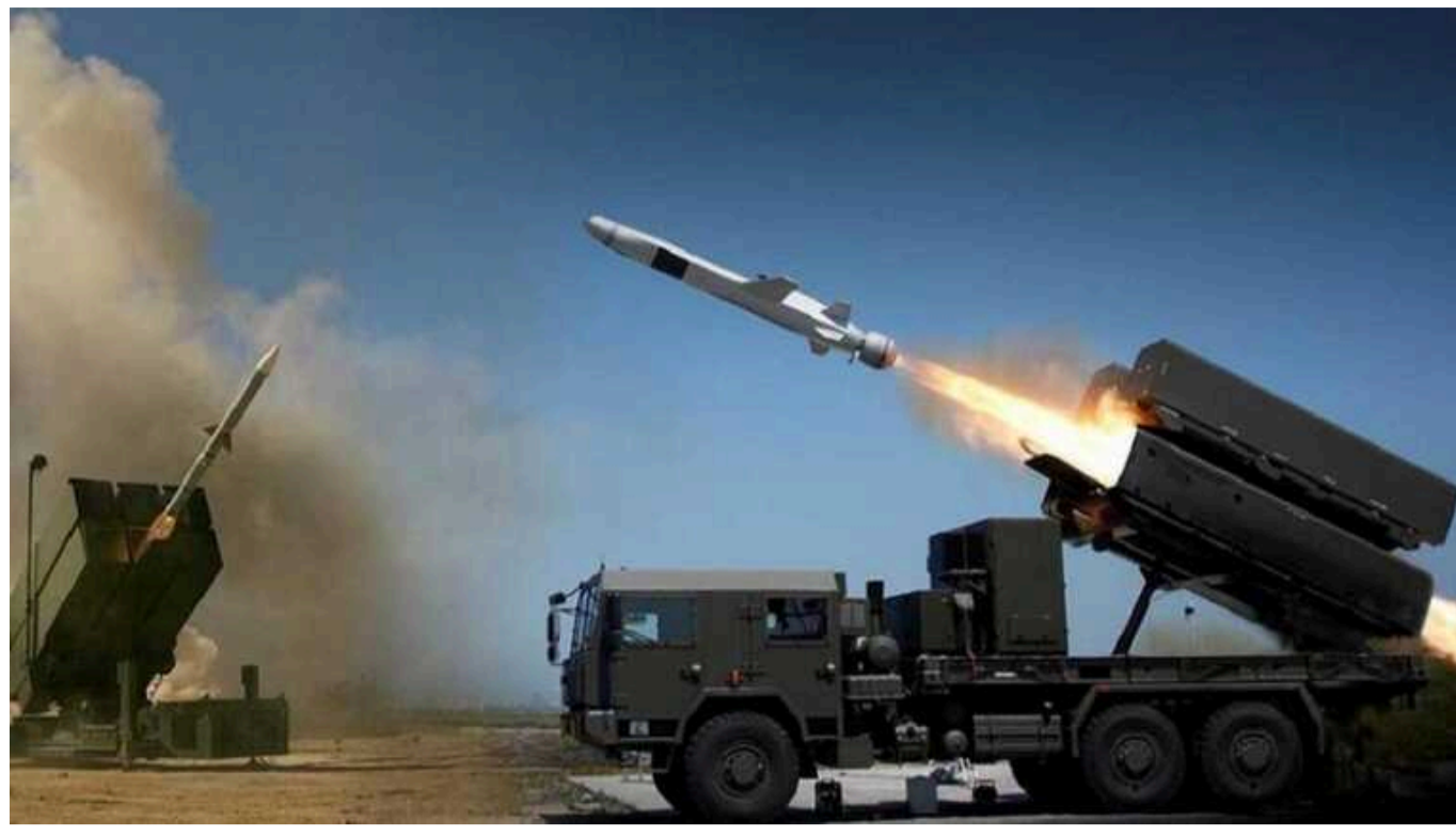
У ЗСУ повідомили про відновлення втрачених позицій на Авдіївському напрямку

Росіяни на Авдіївському напрямі кидають нові резерви та мають деякі локальні успіхи.