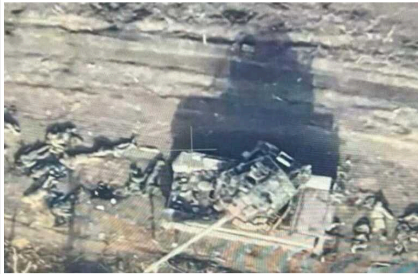
Український блогер показав моторошне відео околиць Авдіївки, яке навряд чи покажуть по РосТВ

На околицях зруйнованої російськими військами Авдіївки все засіяно трупами російських солдатів.