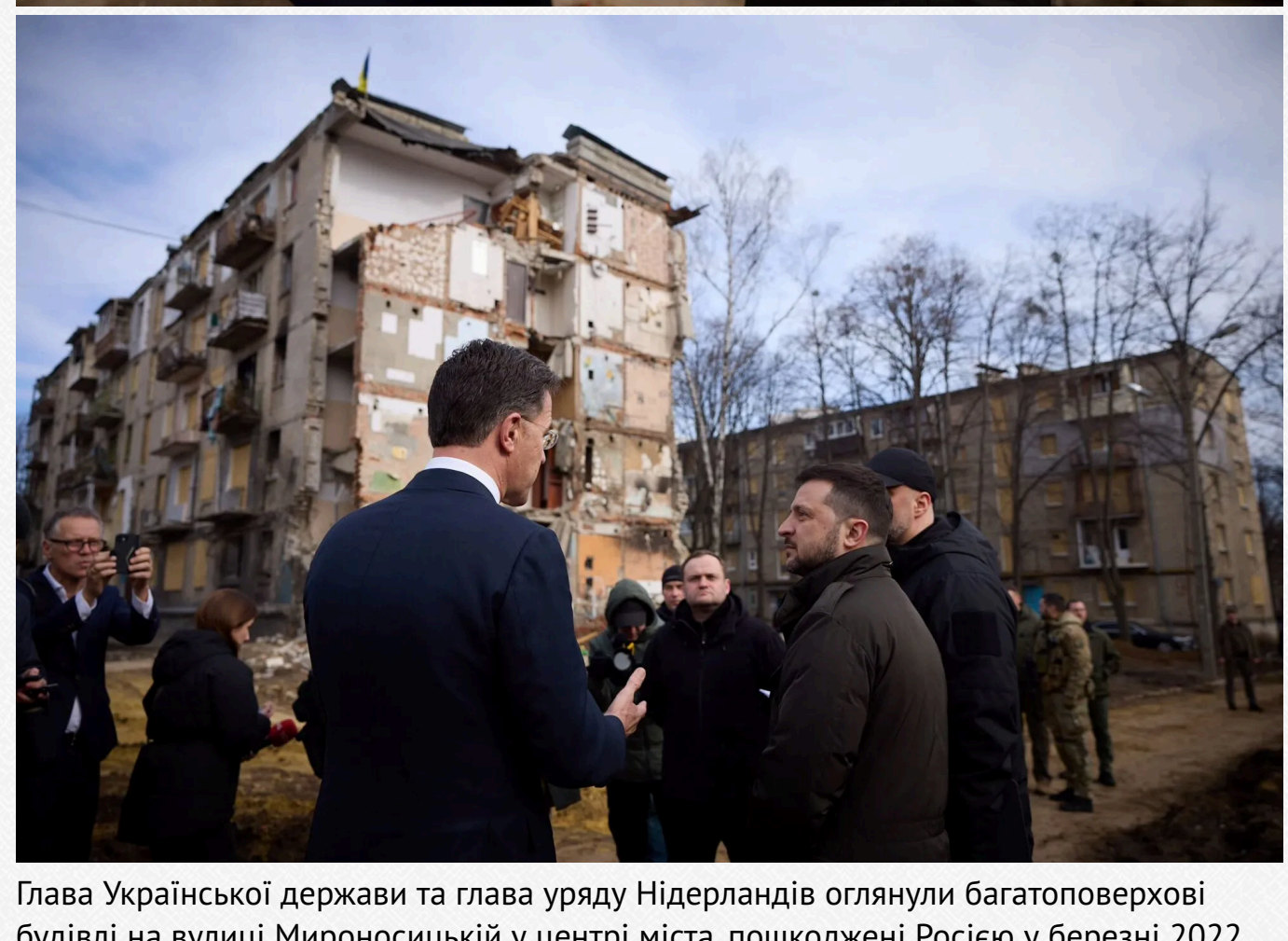
Глава Української держави та глава уряду Нідерландів оглянули багатопверхові будівлі на вулиці Миконосоцькій у центрі міста, пошкоджені Росією у березні 2022 року.