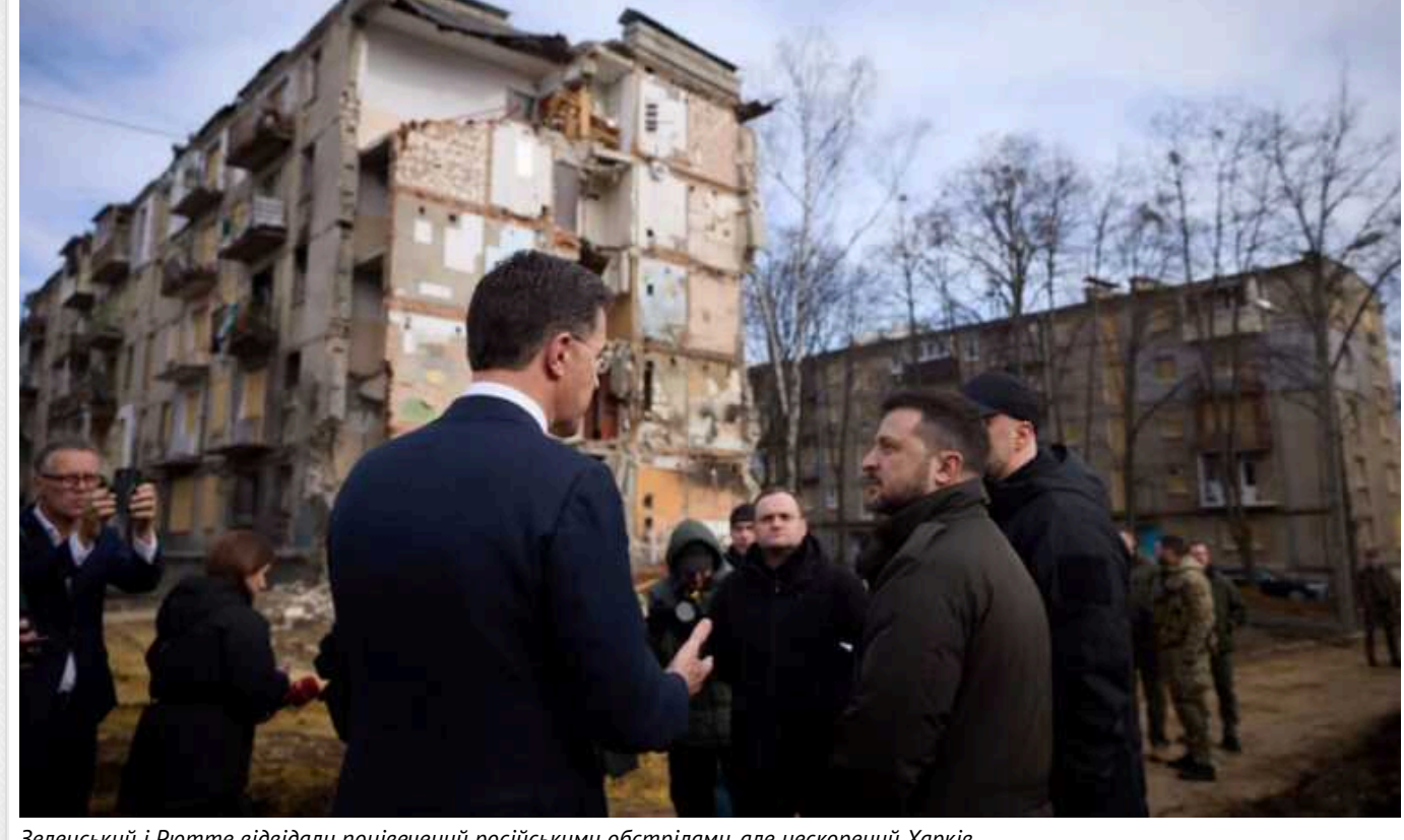
Зеленський і Рютте відвідали понівечений російськими обстрілами, але нескорений Харків

Україну в п'ятницю, 1 березня, з неанонсованим візитом відвідав прем'єр-міністр Королівства Нідерланди Марк Рютте. Він зустрівся з главою нашої держави Володимиром Зеленським у Харкові.