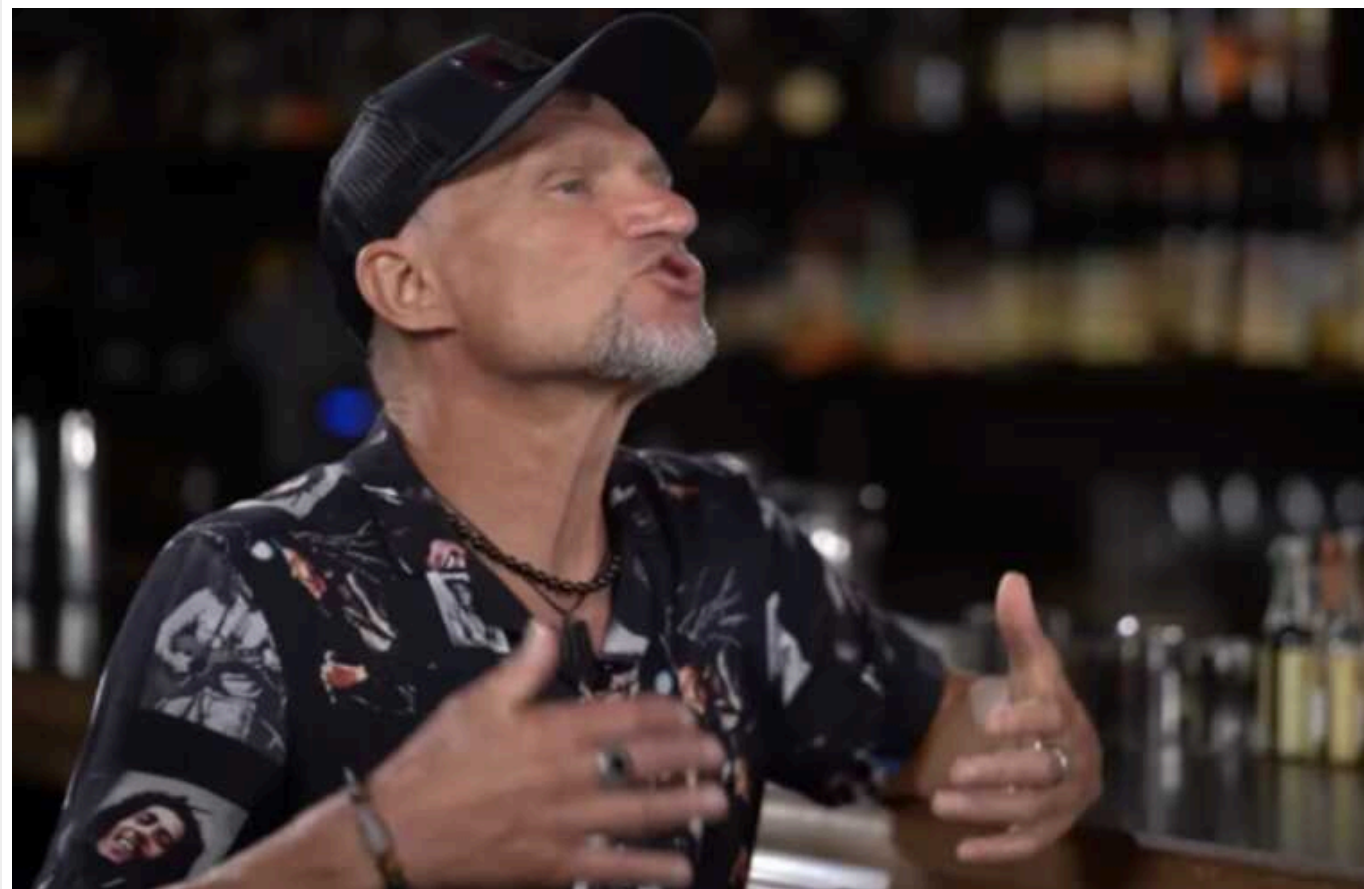
Українська ведуча поставила на місце Олега Скрипку, який переконував, що артисти далекі від війни

Українська ведуча Ольга Немцева пішла наперекір музикантку Олегу Скрипці, який кілька разів потрапляв у скандал через спірні заяви. Під час інтерв'ю артист спробував виправдатися за свою думку, що "війна не тотальна", а тих, хто не хоче воювати, можна відпустити з країни за донат.