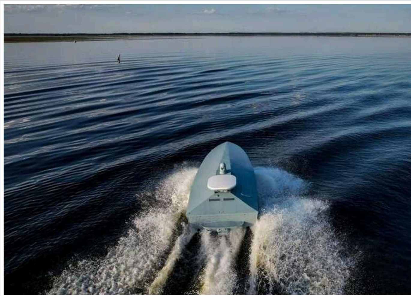
Україна розробила дрони, що топлять російські військові кораблі, більш смертоносними, — Business Insider

За словами генерала Лукашевича, щоб зробити ці дрони ще більшим головним балем для РФ, Україна зробила їх сильнішими, ефективнішими та смертоноснішими: