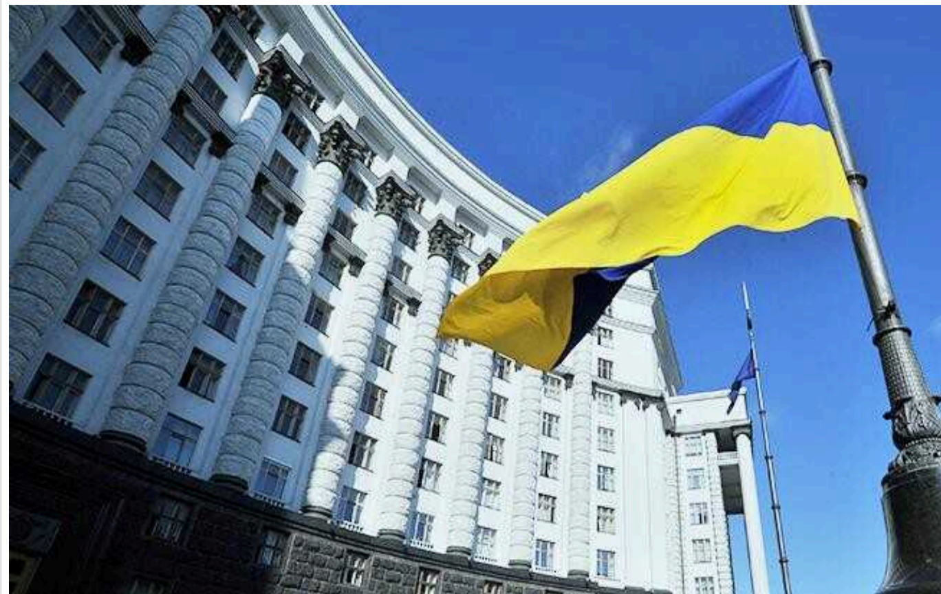
Уряд пропонує створити українські військові адміністрації в окупованому Криму та Севастополі

Український уряд хоче створити в тимчасово окупованому Криму і Севастополі військові адміністрації.