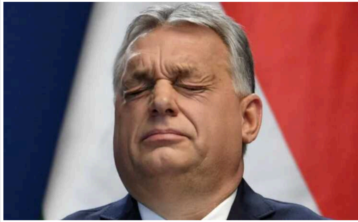
"Час не на боці України": Орбан закликає розпочати мирні переговори з Росією

Угорський прем'єр вважає, що час у ситуації в "українському конфлікті" грає на користь Росії, тому необхідно негайно розпочати мирні переговори.