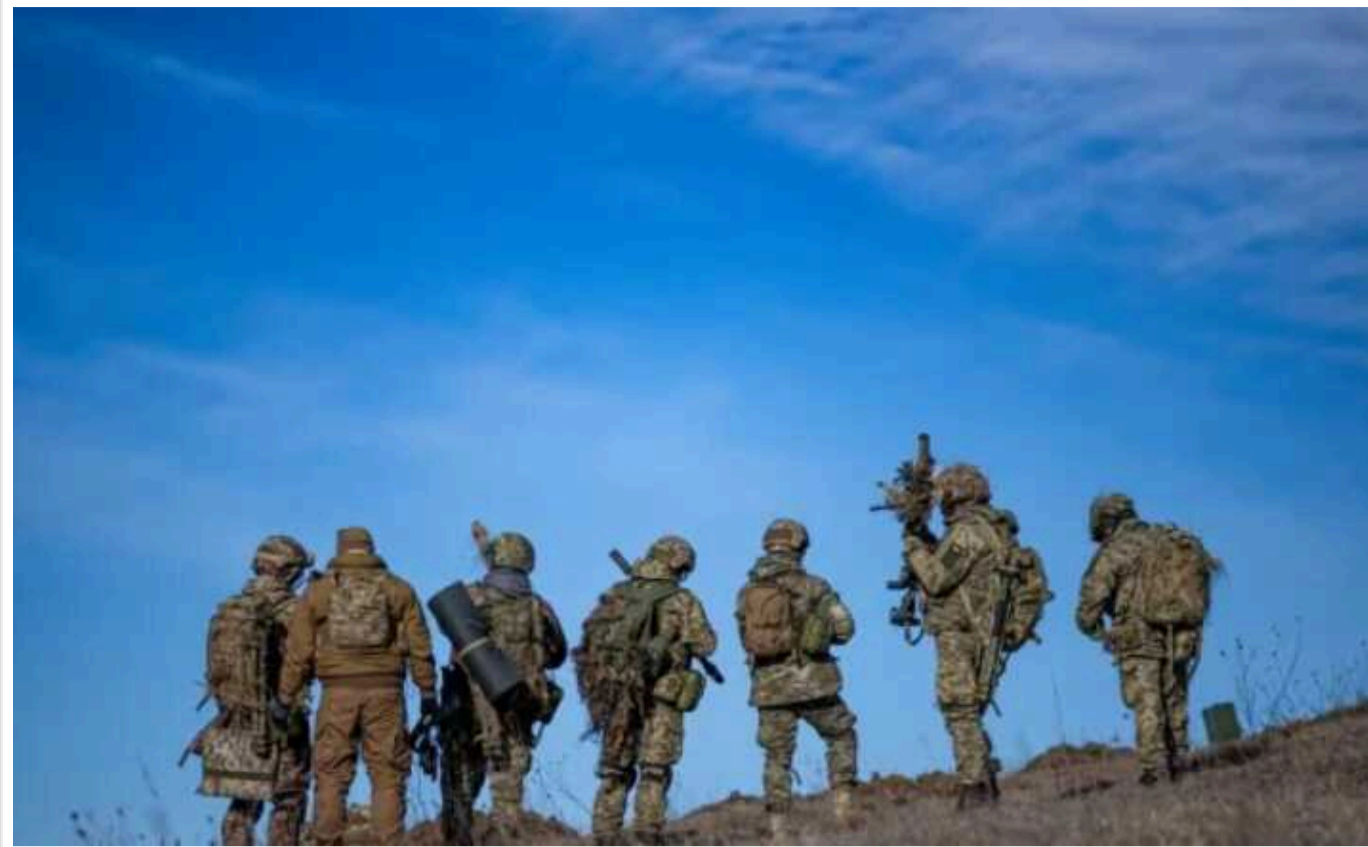
Збройні сили забрали декілька опорників і просунулися під Роботиним, – боєць 65-ї бригади

Українські бійці зізнаються, що мають проблеми з артснарядями, натомість ворожа артилерія боєприпаси не економить.