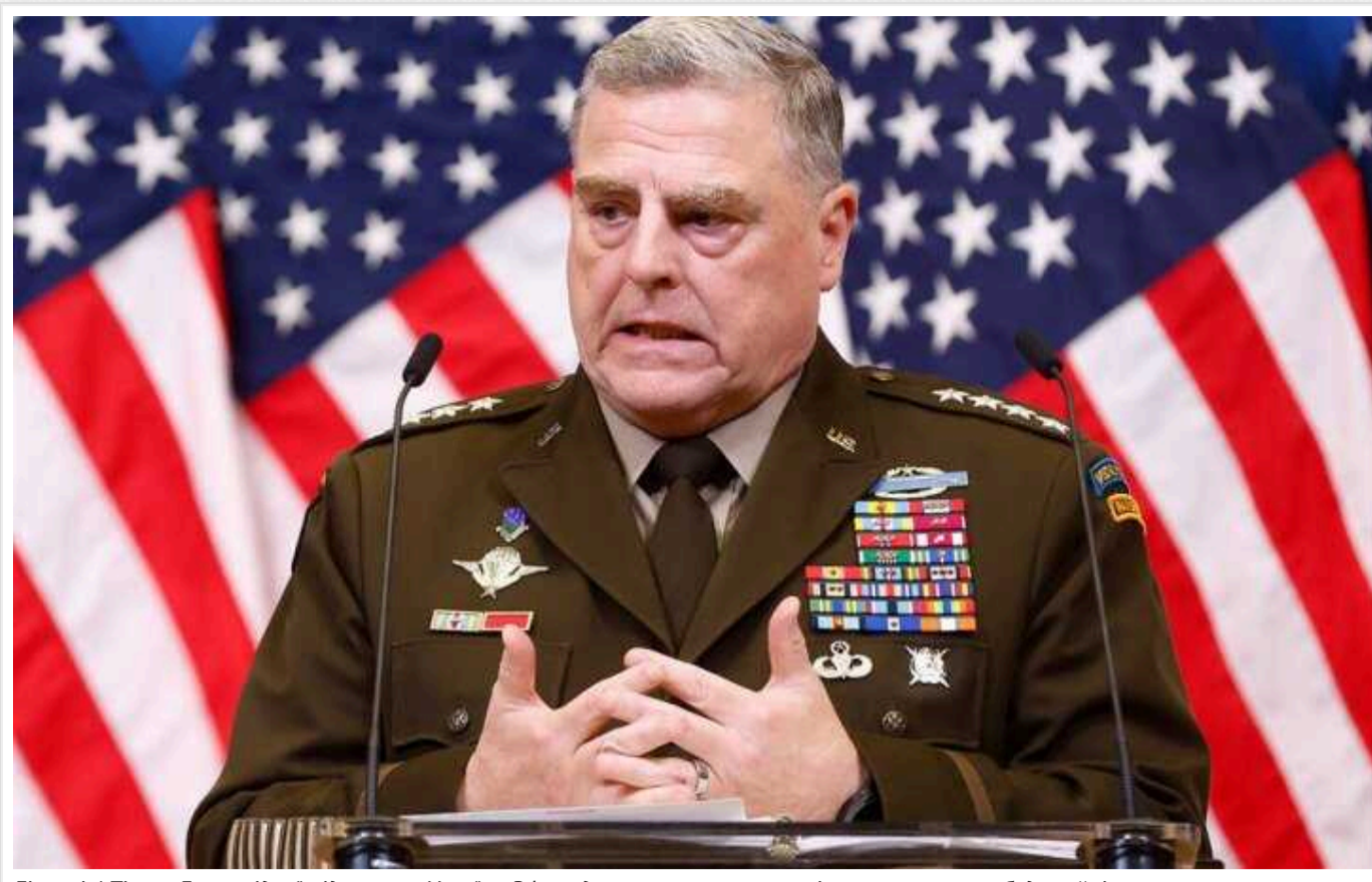
Financial Times: Без західної підтримки України РФ згодом отримає стратегічну перевагу, яка буде руйнівною

Про це Financial Times заявив експоловнокомандувач збройних сил США Марк Міллі.