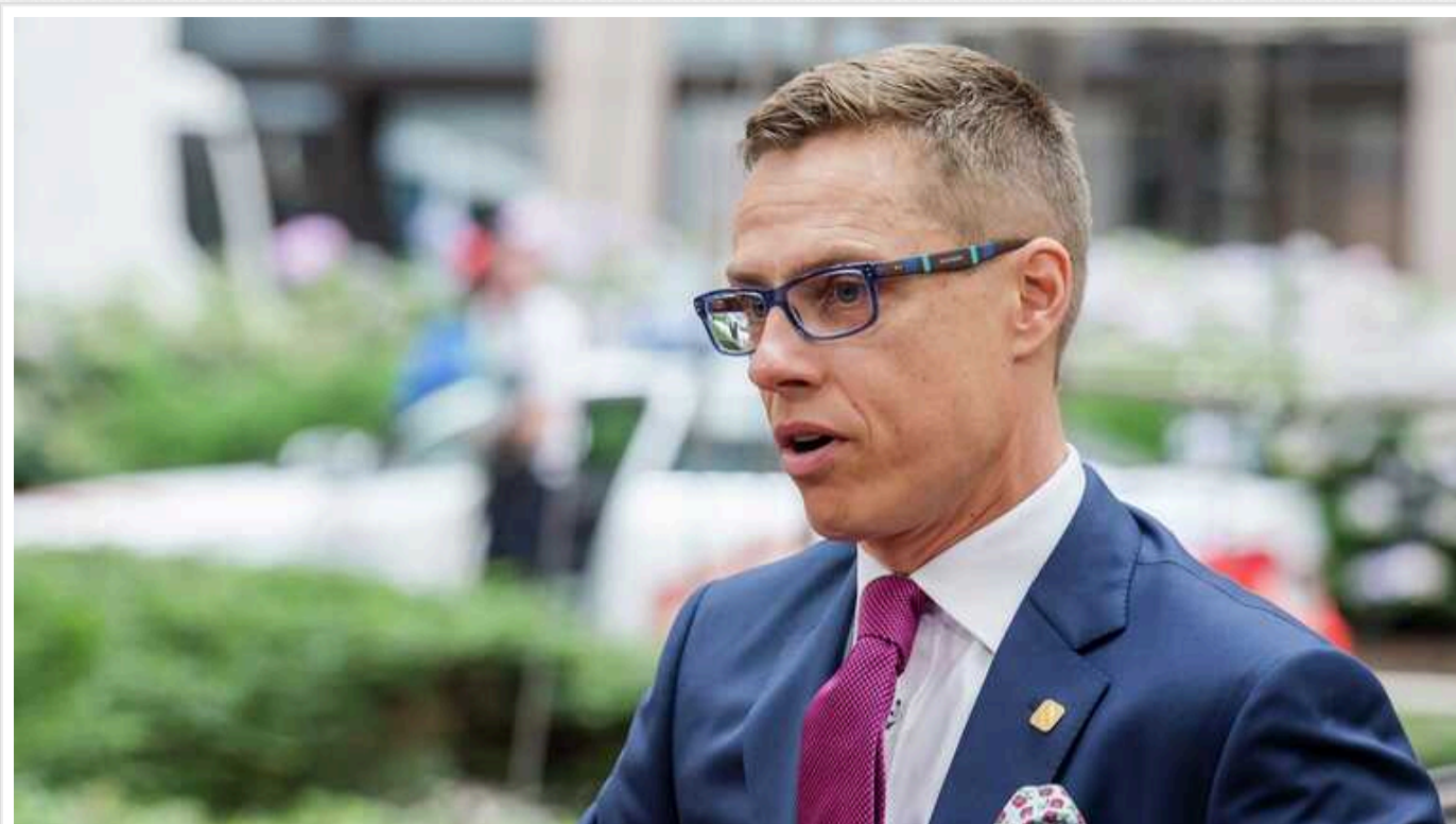
Президент Фінляндії обіцяє ухвалювати «складні рішення» для безпеки країни

Новий президент Фінляндії Александар Стубб у першій промові на посаді, виголошеній 1 березня, заявив, що готовий ухвалювати "складні рішення" для захисту безпеки країни після її вступу до НАТО на тлі напруженості з Росією.