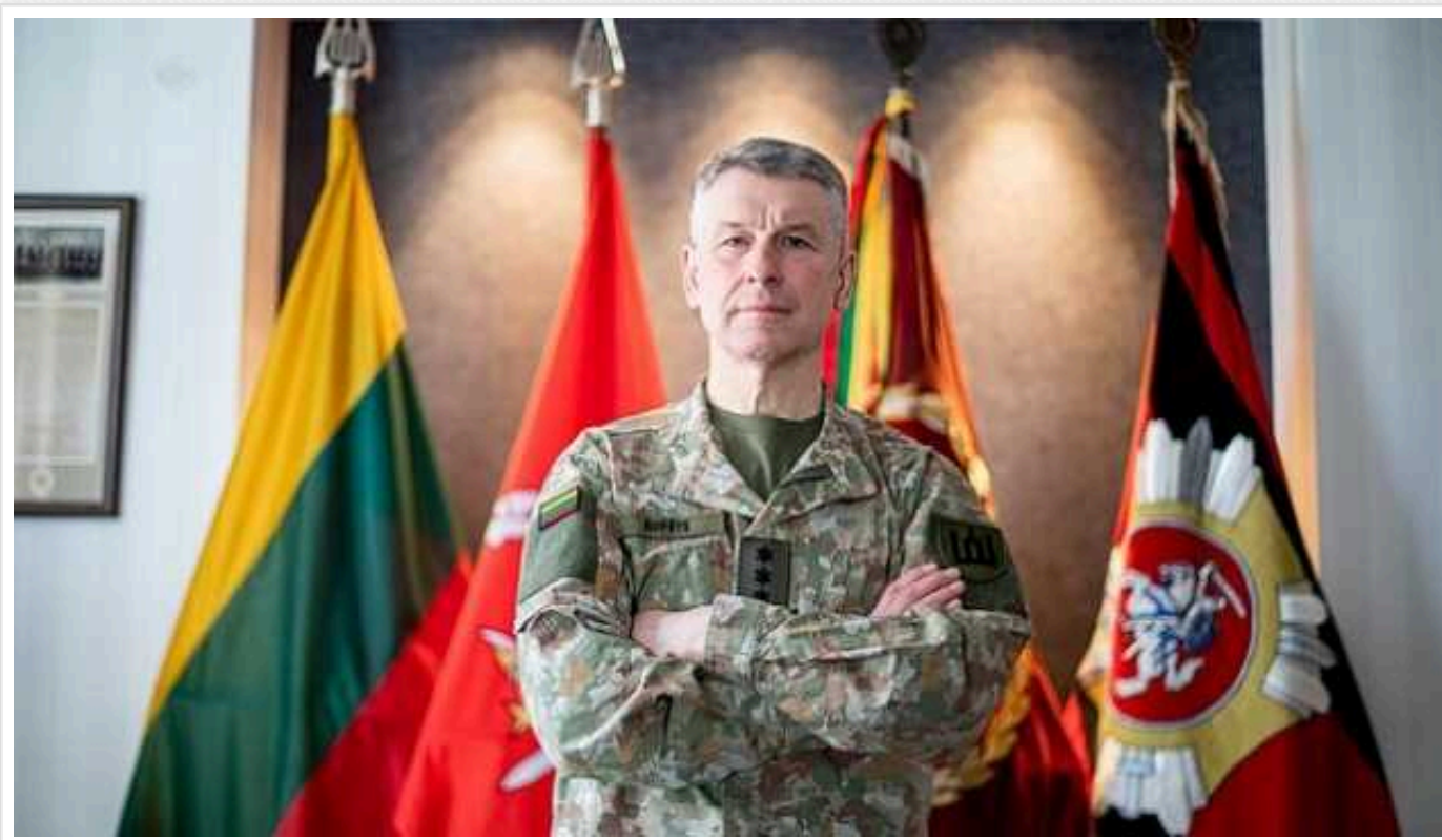
У ЗС Литви на сьогодні не бачать загрози війни

Реагуючи на підвищену тривогу в суспільстві, Збройні сили Литви заявили, що на сьогодні для країни немає загрози війни.