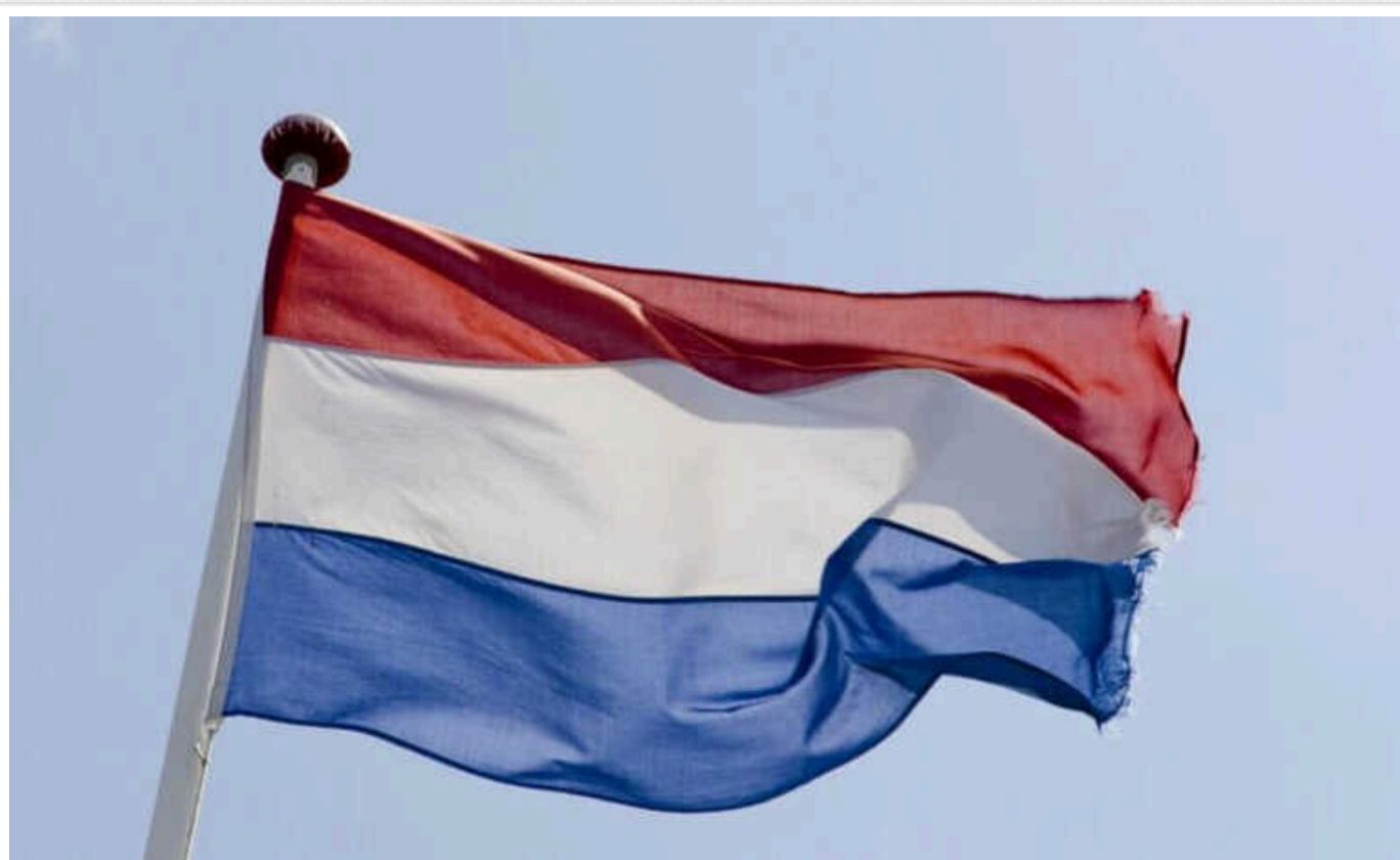
Нідерланди допоможуть Чехії закупити 800 тисяч снарядів для України

Уряд Нідерландів виділяє Україні новий пакет військової допомоги, а також профінансує закупівлю артилерійських снарядів, які знайшла Чехія.