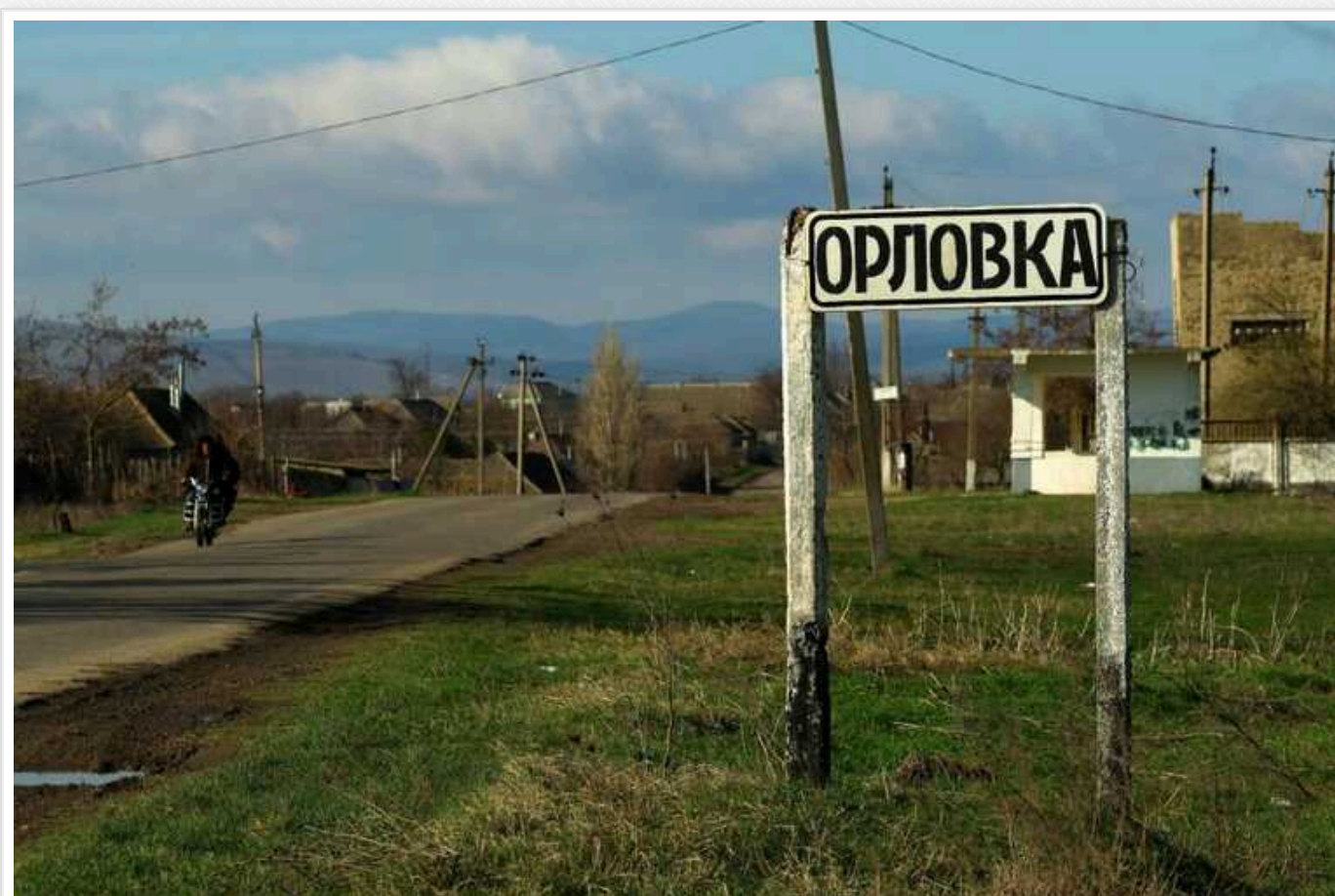
Окупанти, ймовірно, захопили Орлівку, – Юліан Рьопке

Армія РФ, ймовірно, захопила Орлівку на авдівському напрямі, заявляє військовий аналітик Вільд Юліан Рьопке, з посиланням на "українську сторону" (Україна цього не підтверджувала, учора Сирський заявляв, що за Орловкою йдуть бої).