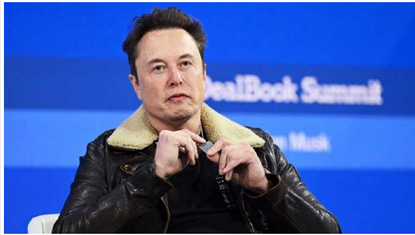
Маск подав до суду на творця ChatGPT та її засновника Сема Альтмана через комерціалізацію ШІ

На думку Маска, OpenAI порушила угоду, укладену під час створення компанії про те, що нейромережа та ШІ перш за все розробляється на благо людства.