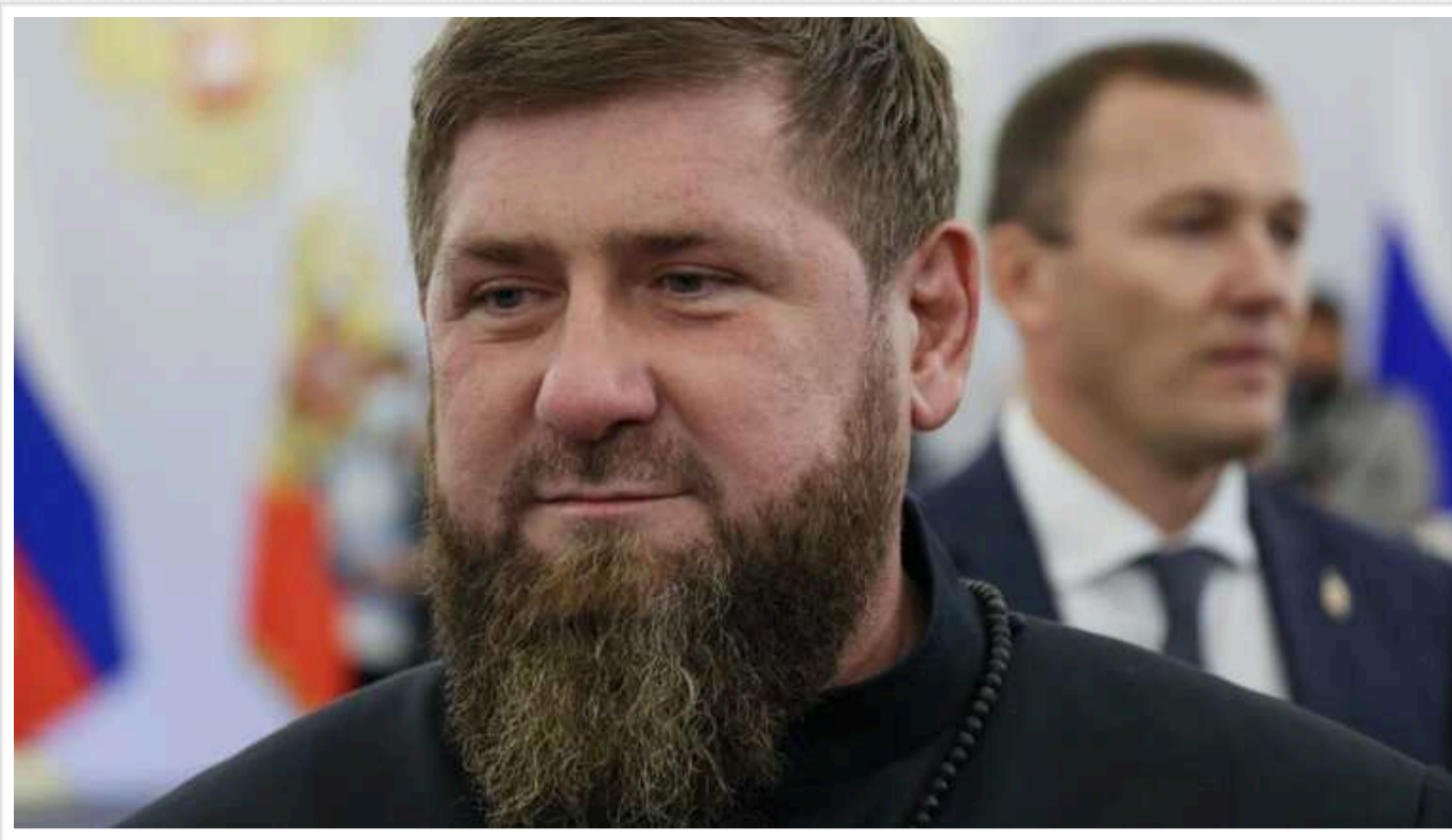
Кадиров «відцензурував» звернення Путіна до Федеральних Зборів: стало відомо, який уривок «викреслив»

Глава Чечні Рамзан Кадиров "відцензурував" фразу президента РФ Володимира Путіна зі звернення до Федеральних Зборів. З речення про "вікову згуртованість і єдність" він "вирівав" згадку про юдеїв.