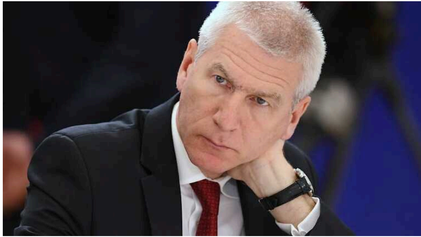
Росія поскаржилася, що МОК порушує право росіян на підтримку Путіна та війни в Україні

Міністр спорту РФ Олег Матицин вимагає від Міжнародного олімпійського комітету (МОК) змінити умови допуску російських спортсменів до змагань, зокрема ОІ-2024. Чинивник назвав неприпустимою антивоєнну позицію атлетів із країни-агресорки, оскільки це є "засудженням дій президента" Володимира Путіна.