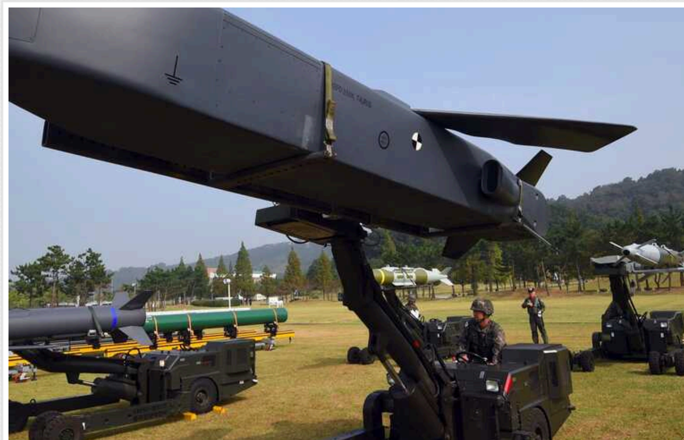
Bloomberg: Велика Британія закликає Німеччину відправити в Україну ракети Taurus, але Шольц не готовий підтримати ідею

Уряд Великої Британії неупублічно закликав Німеччину передати Україні далекобійні ракети Taurus німецького виробництва. Альтернативою прямому постачанню пропонувалася передача ракет Лондону, аби той натомість зміг передати Україні більше власних ракет Storm Shadow.