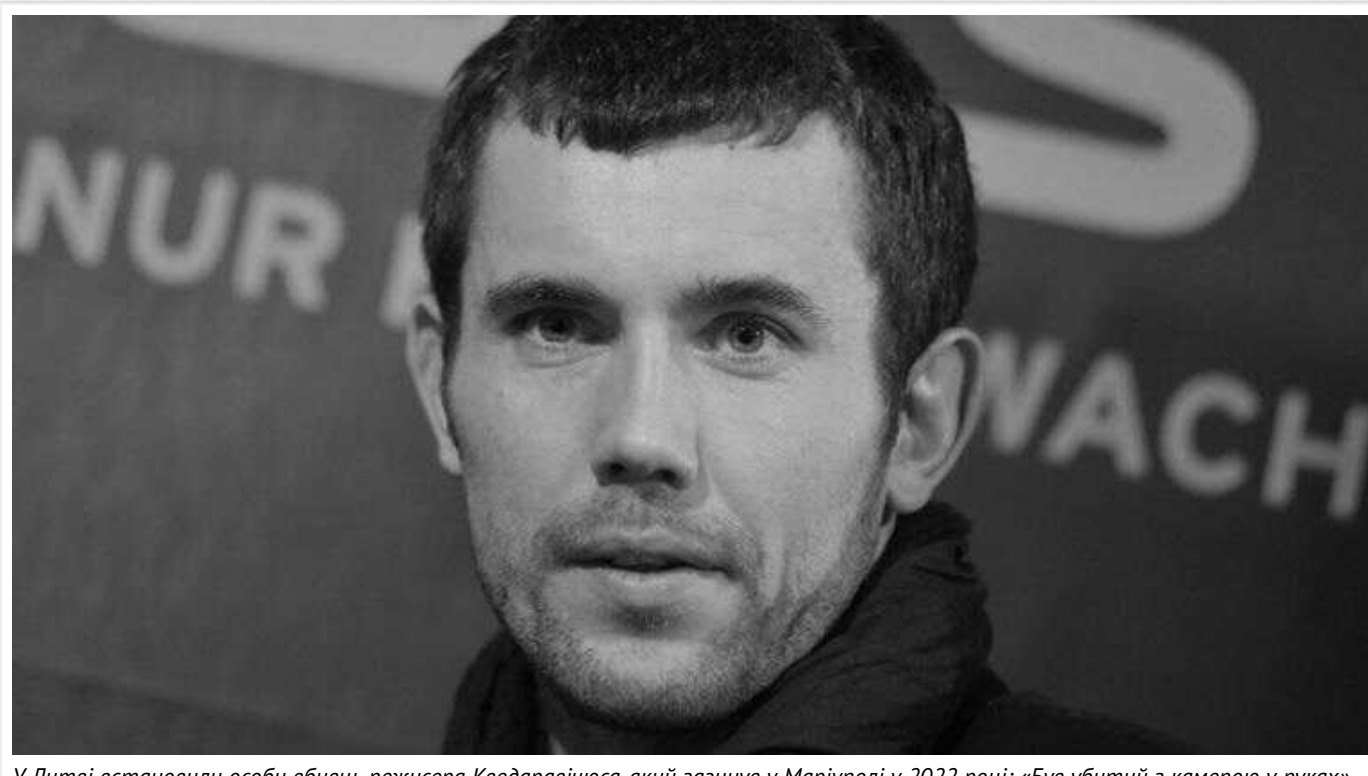
У Литві встановили особи вбивць режисера Кведаравічюса, який загинув у Маріуполі у 2022 році: «Був убитий з камерою у руках»

Генеральна прокуратура Литви встановила особи підозрюваних у вбивстві відомого литовського режисера-документаліста Мانتаса Кведаравічюса. Це сталося у квітні 2022 року у Маріуполі, який окупанти на той час знищували разом із жителями.