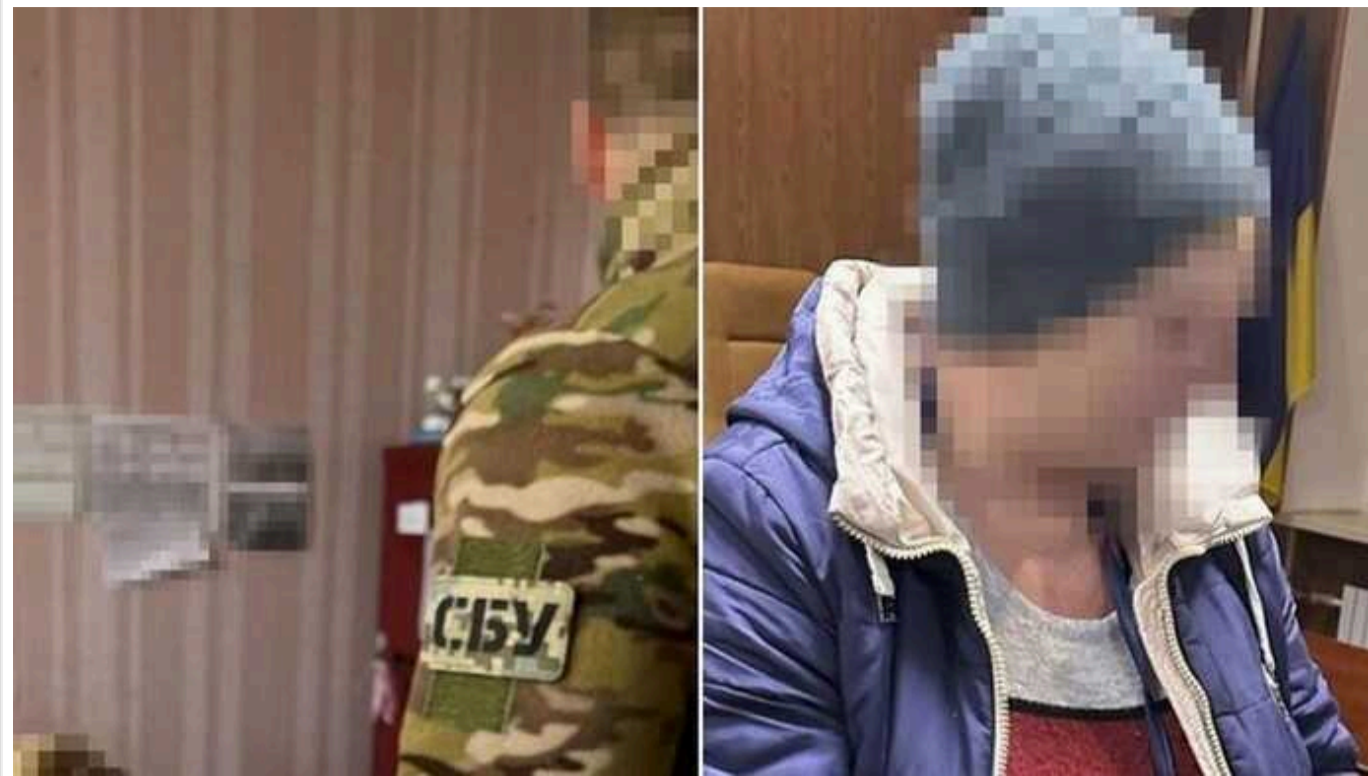
СБУ затримали ексосвітянку, яка «здавала» окупантам українських патріотів під час боїв за Харків

Кіберфахівці Служби безпеки викрили ще одну прихильницю рашизму, яка співпрацювала з окупантами після захоплення Харківщини.