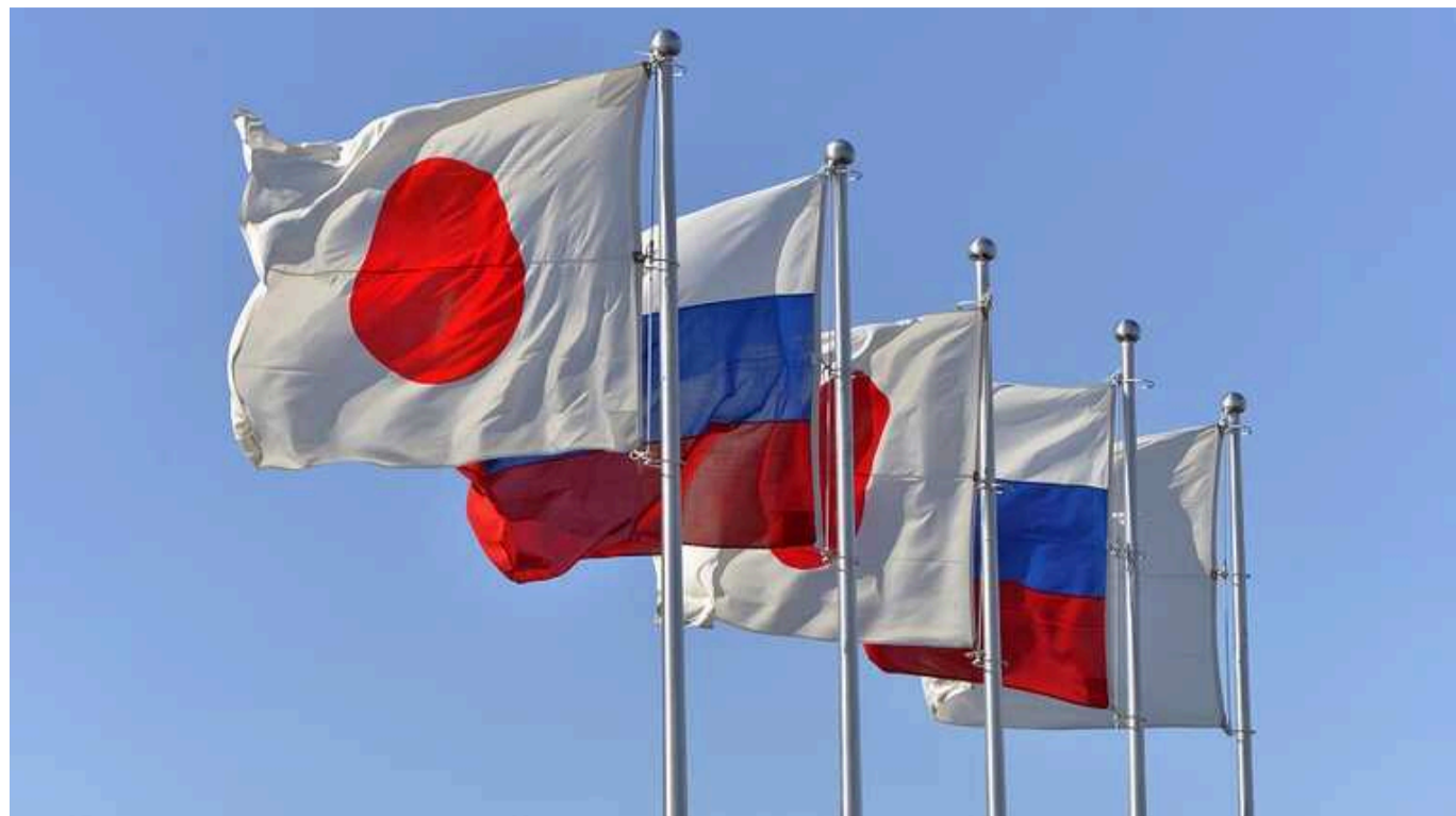
Японія вдарила по Росії новими санкціями: заборона алмазів, «Калашников» у чорному списку

Японія розширила санкції проти Росії у відповідь на агресивну війну проти України. Так, Японія забороняє ввезення алмазів російського походження. Під обмеження потрапили, серед інших, посадовці з Чечні, збройові концерни "Калашников" та "Алмаз-Антей", а також банк "Тінккофф".