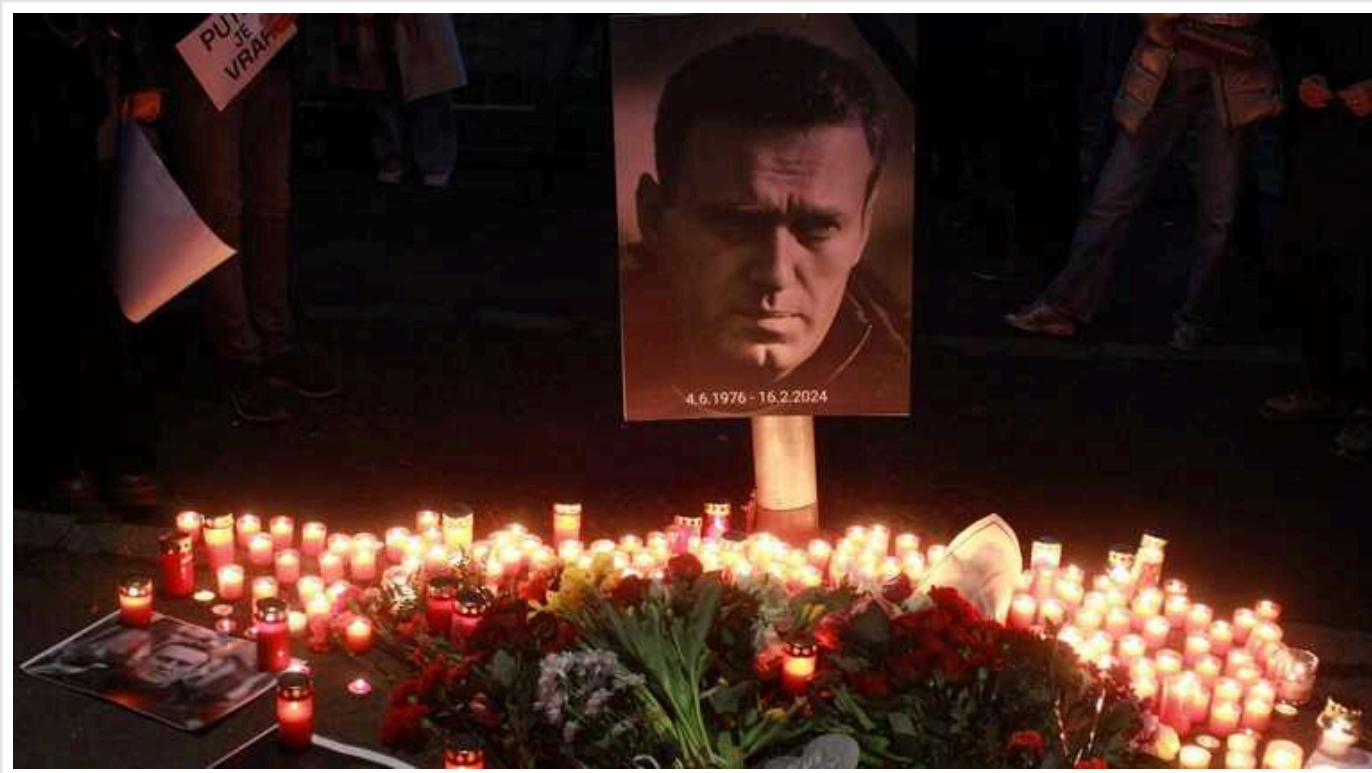
Похорон Навального: відспівування пройде о 13 годині за київським часом у церкві в районі Мар'їно

Відспівування пройде о 13 годині за київським часом у церкві "Утоли моя печали" в районі Мар'їно.