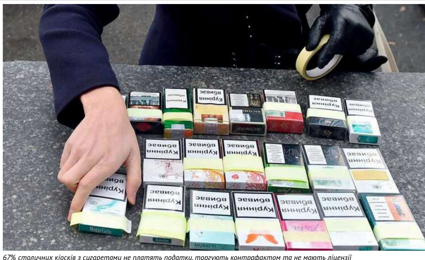
67% столичних кіосків з сигаретами не платять податки, торгують контрафактом та не мають ліцензії

Ви ж пам'ятаєте шокуючу статистику нелегального тютюнового ринку у 25%, де держава щорічно втрачає 23 млрд. гривень, і що в цю проблему вже включились посли G7 та спецпредставники від США по корупції в Україні.