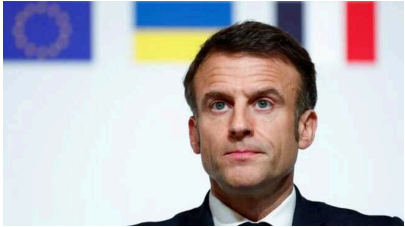
«Помилка» Макрона із заявою про відправку військ тільки ще більше ускладнила ситуацію в Україні, - Politico

Politico вважає, що Україна перебуває у «важкому становищі», а «помилка» Макрона із заявою про відправку військ лише ще більше посилює ситуацію.