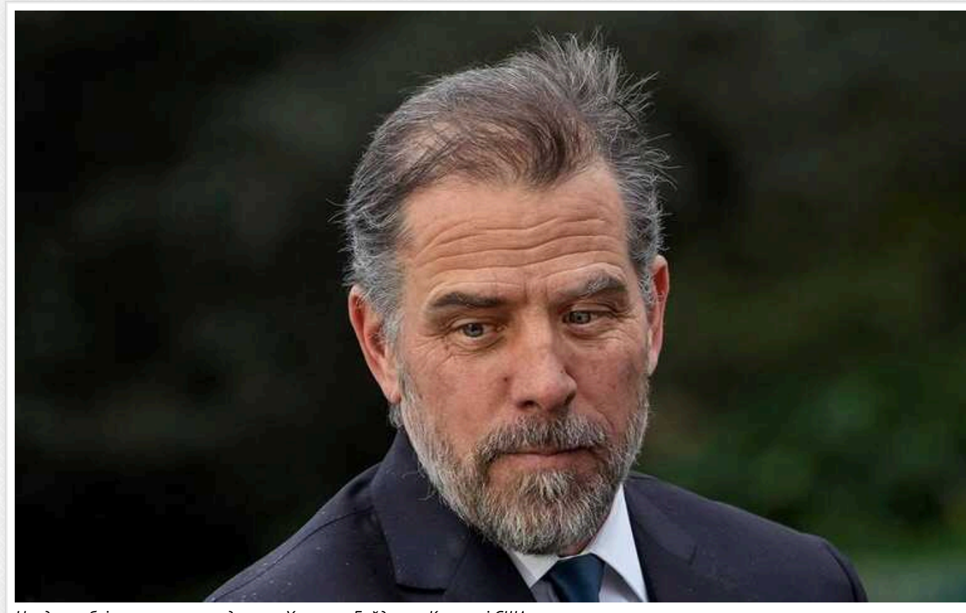
Нардеп публікує стенограму допиту Хантера Байдена у Конгресі США

Вчора опублікували стенограму допиту Хантера Байдена у Конгресі США.